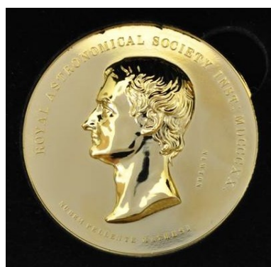
Figure 3 - Médaille d'or de la Royal Astronomical Society

Toutefois la question refait surface dans le procès-verbal du 19 mai 1880. Hervé Faye, président, lit une communication de George Biddell Airy (1801-1892), Astronome royal, directeur de l'observatoire de Greenwich dans les Monthly Notices de la Royal Astronomical Society. Ses calculs remettent à l'honneur la valeur de 10'' mais pour une courte durée puisque, le 16 juin, Hervé Faye fait part de l'amende honorable de Airy : alors qu'il pensait la détermination d'Adams et Delaunay entachée d'erreur, il reconnaît que c'est la sienne qui est défectueuse.