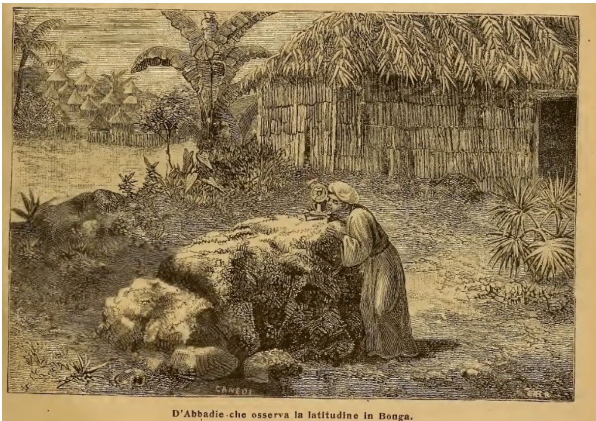
Figure 2 - Antoine d'Abbadie observant la latitude à Bonga (Éthiopie) 3

Son expédition en Éthiopie fait de d'Abbadie un expert du voyage d'exploration. Il publie une carte levée en voyage par sa méthode de « géodésie expéditive », c'est-à-dire une triangulation réalisée sur des mires naturelles et avec une mesure des distances au pas. Son entrée au Bureau accompagne la politique impériale de la III e République. L'expertise des voyageurs est utile à la « nébuleuse coloniale » : d'Abbadie contribue aux liens du Bureau avec la Société de Géographie de Paris dont il est un membre important. Formation des voyageurs, choix des instruments pour le voyage, préparation d'expéditions africaines sont les domaines privilégiés dans lesquels intervient d'Abbadie.