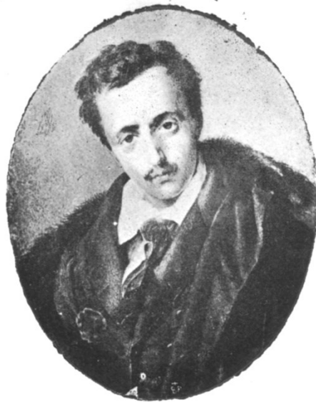
M. ANTOINE D'ABBADIE

Promoteur de voyages en Afrique et d'études géodésiques, il est le parrain des expéditions de Brazza. Il en rapporte les projets puis les résultats au Bureau (projet de sa mesure exposé dans la séance du 30 janvier 1889 : “Rapport sur la mesure d'un axe de Méridien au Congo”).