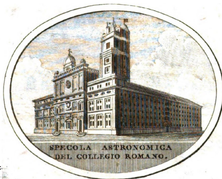
Figure 2 - Tour de l'observatoire du Collège Romain

Si le Bureau n'était pas invité au sacre en tant qu'institution, plusieurs de ses membres y assistent en raison de leur fonction politique : Louis Antoine de Bougainville (1729-1811), Joseph-Louis Lagrange (1736-1813) et Pierre-Simon de Laplace (1749-1827) en tant que membres du Sénat, Charles-Pierre Claret de Fleurieu (1738-1810) comme membre du Conseil d'État. La délégation qui assiste à l'entrevue avec le souverain pontife, deux mois plus tard, est dirigée par Jérôme de La Lande (1732-1807). Son athéisme militant (Porset, 2010) – il est l'auteur, avec Sylvain Maréchal (1750-1803) d'un Dictionnaire des athées et tous deux sont à l'origine de la fondation de la « Société des Hommes sans Dieu » en 1797 – est connu du Pape. Pendant l'entretien, ce dernier lui aurait déclaré, selon un rapport de police et le témoignage d'un des cardinaux présents, « qu'il était impossible qu'un astronome aussi savant ne connaisse pas le suprême créateur du système des planètes » (Ticchi, 2005). Pie VII s'intéresse à l'astronomie. Le physicien et jésuite Sabino Maffeo, de l'observatoire du Vatican, écrit que cet intérêt est né lors de l'observation de l'éclipse de soleil du 11 février 1804 (Maffeo, 2001), quelques mois avant le déplacement parisien. Il s'inscrit surtout dans une histoire plus longue de réforme de la politique scientifique du pontificat romain sous l'influence des lumières (Montègre, 2012) et les coups de boutoir révolutionnaires (Pepe, 2007).