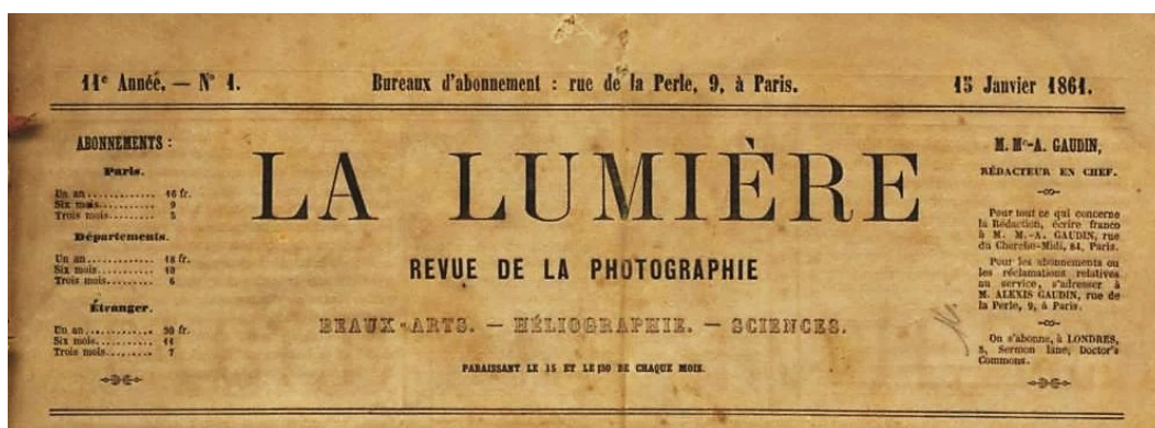
Figure 3 - Page titre de La Lumière , avec mention du nom du rédacteur en chef, M.-A. Gaudin

Si Gaudin rentre dans le rang, il manifeste une grande activité éditoriale (Figure 3). En effet, entre 1844 et le début des années 1860, il publie au moins une dizaine d'ouvrages autour des perfectionnements chimiques et mécaniques du daguerréotype 13 .