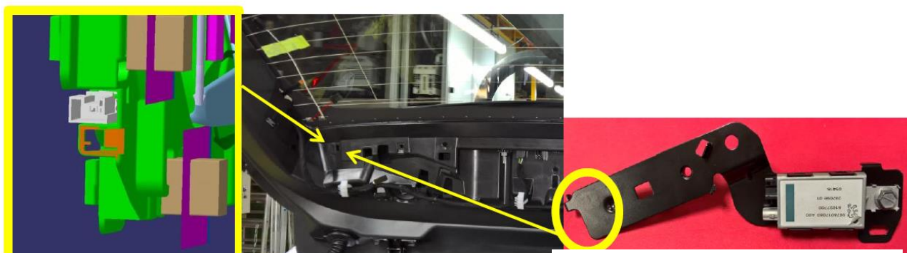
Modélisation 3D de l'emplacement où les connecteurs sont neutralisés

Forts de ces observations, il a été décidé de mettre en place des indices physiques permettant de guider l'activité de l'opérateur. La solution la moins coûteuse est que le support du boîtier (voir Figure 3 ci-dessus, à droite) soit inséré à l'endroit où les connecteurs sont neutralisés (voir Figure 4 ci-dessus, à gauche). Ainsi en présence du boîtier, l'opérateur verra toute tentative de neutralisation des connecteurs échouée, son chemin étant barré par le support du boîtier. Notre recommandation ayant été acceptée par les responsables de production et les concepteurs des produits chez PSA, les orifices accueillant les supports des boîtiers DAB/FM/AM ont été modifiés. Cette préconisation est toujours en vigueur sur la ligne.