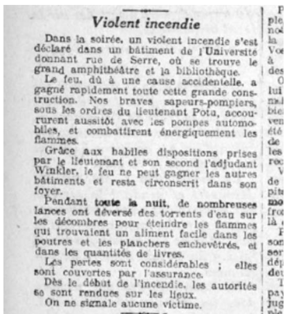
Est républicain du 4 novembre 1918, page 2

Le compte rendu de cet épisode par la presse de l'époque fournit également un éclairage sur l'état d'esprit qui régnait au bout de 4 années d'une guerre particulièrement éprouvante. L'Est Républicain parle d'un incendie, sans évoquer le fait de guerre. Orientation de l'information, peut-être pour ne pas démoraliser davantage une population nancéenne à bout de souffle ? Fake news dirions-nous aujourd'hui, désinformation de la part d'une presse aux ordres, propagande ? Ou plutôt anticipation d'un armistice qui allait arriver 10 jours plus tard, et volonté déjà de tourner la page de la guerre afin de se projeter vers les années folles ? S'il s'agissait de positiver, cent ans plus tard, force est de constater que l'avenir a donné raison aux optimistes. Après la destruction, les dons ont afflué de toutes parts, permettant de reconstituer les collections ; un magnifique bâtiment art-déco a été reconstruit dans les années 30 ; la bibliothèque de l'université de Nancy s'appelle aujourd'hui la DDE (Direction de la Documentation et de l'Édition) et elle regroupe 28 BU, qui totalisent 2 millions de documents, et plus de 2 millions d'entrées par an ; l'université de Nancy s'appelle maintenant l'Université de Lorraine, et elle fait partie de l'université de la Grande Région dont 3 universités allemandes sont partie prenantes. L'épisode du bombardement ne doit cependant pas être oublié, il nous oblige à être vigilants pour la sauvegarde de notre patrimoine documentaire.