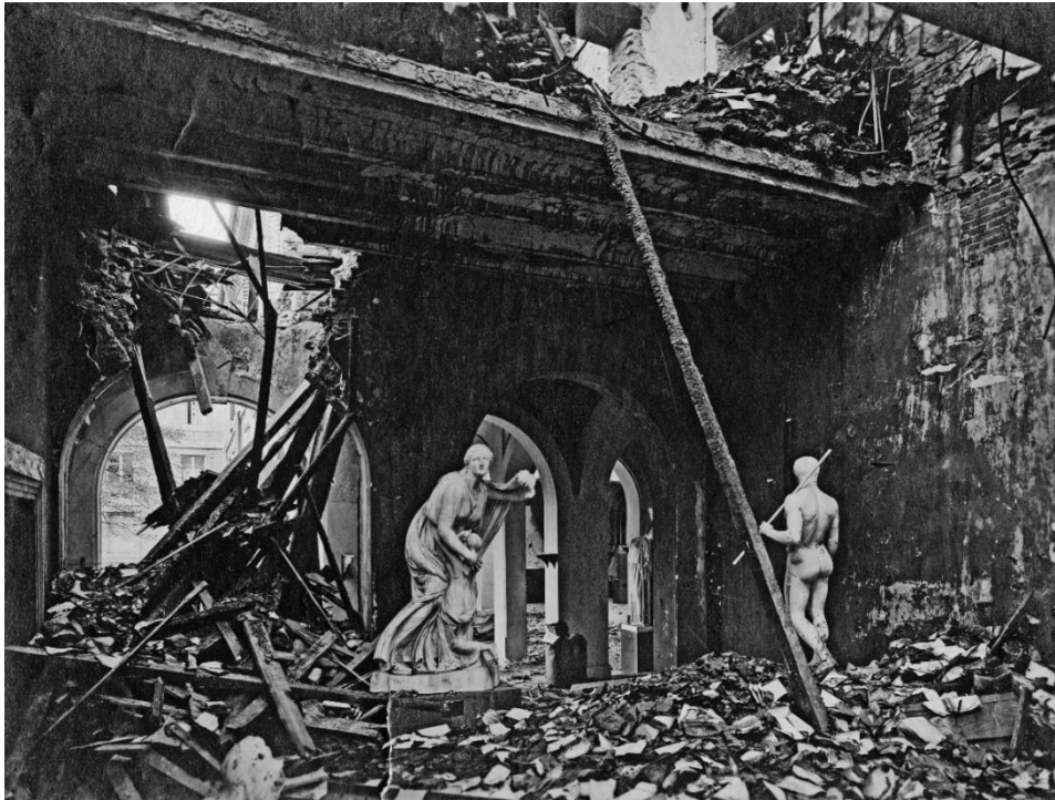
Ancien musée archéologique et premier étage de la bibliothèque après l'incendie

que furent ses magasins. Le soleil de novembre éclaire à travers les décombres les formes humanoïdes des statues, rares rescapées du musée archéologique, presque entièrement détruit par le feu.