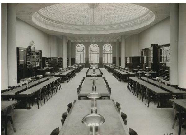
Grande salle de la nouvelle bibliothèque reconstruite dans les années 30

Le compte rendu de cet épisode par la presse de l'époque fournit également un éclairage sur l'état d'esprit qui régnait au bout de 4 années d'une guerre particulièrement éprouvante. L'Est Républicain parle d'un incendie, sans évoquer le fait de guerre. Orientation de l'information, peut-être pour ne pas démoraliser davantage une population nancéenne à bout de souffle ? Fake news dirions-nous aujourd'hui, désinformation de la part d'une presse aux ordres, propagande ? Ou plutôt anticipation d'un armistice qui allait arriver 10 jours plus tard, et volonté déjà de tourner la page de la guerre afin de se projeter vers les années folles ? S'il s'agissait de positiver, cent ans plus tard, force est de constater que l'avenir a donné raison aux optimistes. Après la destruction, les dons ont afflué de toutes parts, permettant de reconstituer les collections ; un magnifique bâtiment art-déco a été reconstruit dans les années 30 ; la bibliothèque de l'université de Nancy s'appelle aujourd'hui la DDE (Direction de la Documentation et de l'Édition) et elle regroupe 28 BU, qui totalisent 2 millions de documents, et plus de 2 millions d'entrées par an ; l'université de Nancy s'appelle maintenant l'Université de Lorraine, et elle fait partie de l'université de la Grande Région dont 3 universités allemandes sont partie prenantes. L'épisode du bombardement ne doit cependant pas être oublié, il nous oblige à être vigilants pour la sauvegarde de notre patrimoine documentaire.