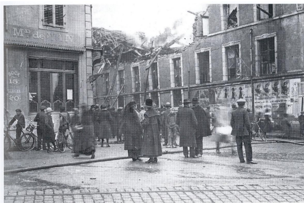
La bibliothèque après l'incendie, vue de la rue de Serre. (Collection Direction de la Documentation et de l'Édition – Bibliothèque universitaire de droit et sciences économiques).