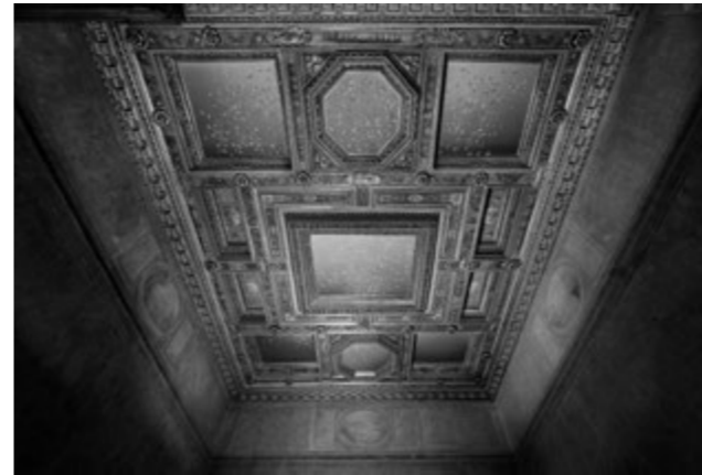
11 Claudio Parmiggiani, plafond de « La Chambre des Amours », © Claudio Abate, Académie de France à Rome - Villa Médicis, 2015.