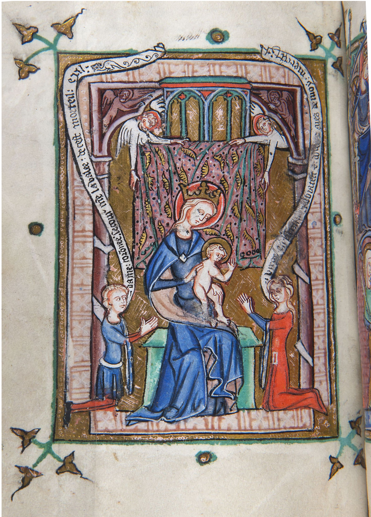
1. - Fol.14v : La Vierge et l'Enfant entourée des destinataires du livre d'heures. Le jeu des regards et des échelles met particulièrement en avant la femme.