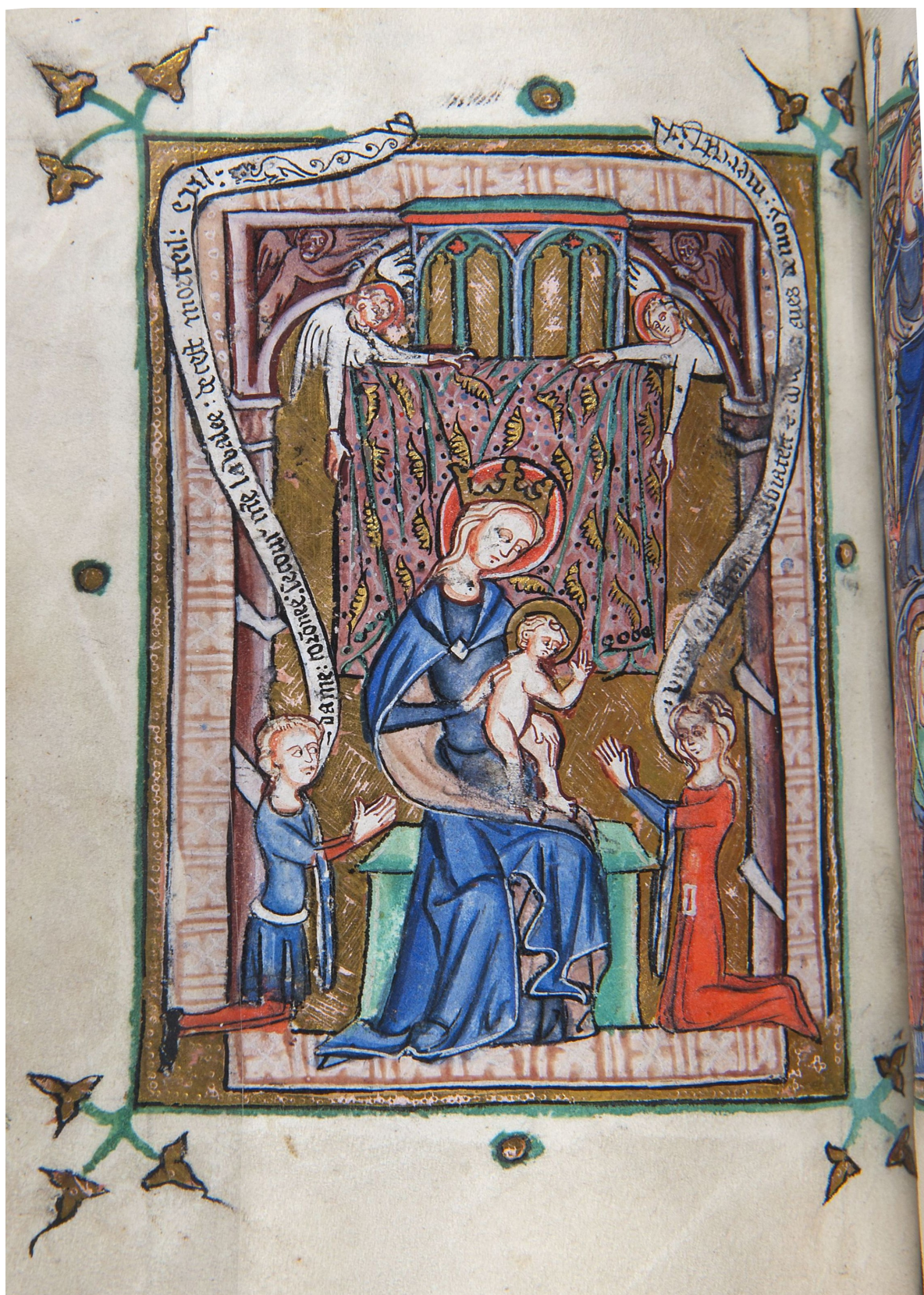
1. - Fol.14v : La Vierge et l'Enfant entourée des destinataires du livre d'heures.

Le jeu des regards et des échelles met particulièrement en avant la femme.