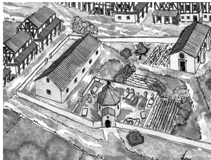
Fig. 5 - Essai de reconstitution de la commanderie templière de Metz (A. REIFF)