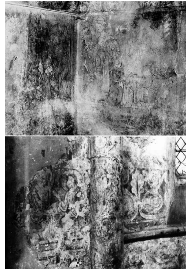
Fig. 2 - Fresques disparues de l'oratoire des Templiers (XIII e )