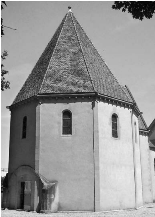
Fig. 1 - Oratoire des Templiers