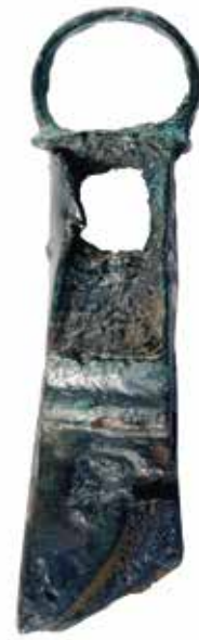
Couteau à tailler les calames. Parc archéologique européen de Bliesbruck-Reinheim.

La localisation des découvertes d'instruments liés à l'écriture permet d'échafauder certaines hypothèses quant aux endroits où l'on écrivait. Bien entendu, cette analyse spatiale ne sera que partielle puisque tout le site n'a pas encore été fouillé. Mais, de façon générale, du matériel lié à l'écriture a été mis au jour sur l'ensemble du site de Bliesbruck. Réparti de façon inégale, ce matériel a été retrouvé autant dans les quartiers artisanaux que dans les boutiques longeant les thermes et montre que l'écriture était pratiquée dans l'ensemble de l'agglomération.