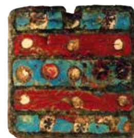
Exemples de boîtes à sceller. Parc archéologique européen de Bliesbruck-Reinheim.

Enfin, la pratique de l'écriture sur des tablettes, lesquelles se présentent souvent sous forme de diptyques, est confirmée par des objets indirectement liés à l'écriture : les boîtes à sceller. Douze exemplaires de ces dernières, parfois décorés d'émail, ont été découverts. Elles servaient à protéger les tablettes des regards indiscrets. Une ficelle était passée dans les trois ou quatre trous du fond de la boîte et entourait la tablette. Puis de la cire était versée à l'intérieur et la boîte était refermée après que l'expéditeur y eut apposé sa marque avec le chaton d'une bague.