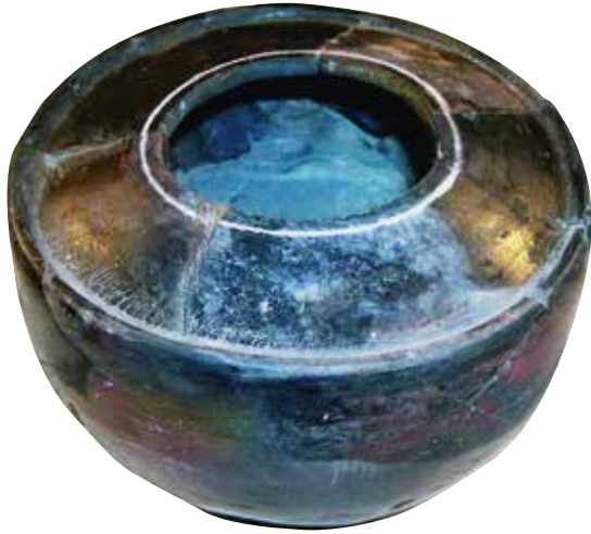
Encrier en céramique sigillée. Parc archéologique européen de Bliesbruck-Reinheim.

découverts à Bliesbruck : deux sont en sigillée et le dernier en céramique engobée de provenance régionale. Leur taille est peu ordinaire puisqu'ils sont plus volumineux que leurs homologues en bronze. Une caractéristique d'ailleurs difficilement explicable ; peut-être étaient-ils utilisés pour des pratiques requérant de grandes quantités d'encre, comme la copie ; ou, plus simplement, leur fabrication était-elle moins coûteuse, car il ne faut pas oublier que la céramique était produite en abondance en Gaule. Quant aux calames, aucun n'a été retrouvé sur le site en raison de la biodégradabilité de ces roseaux. Mais la présence de petits couteaux à tailler les calames, dont la lame est oblique et non arrondie comme pour la majorité des instruments, suggère que ces plumes étaient utilisés pour l'écriture à l'encre.