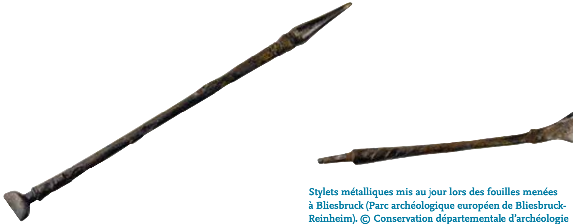
Stylets métalliques mis au jour lors des fouilles menées à Bliesbruck (Parc archéologique européen de Bliesbruck-Reinheim).

de centimètres, encadrée d'une pointe pour écrire et d'une palette pour effectuer des corrections sur la cire molle. Soixante-seize de ces instruments, datés du I er au IV e siècle et présentant des formes diverses, ont été découverts.