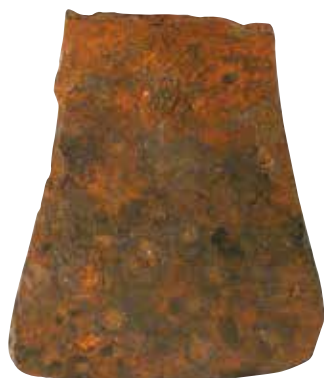
Spatule à cire. Parc archéologique européen de Bliesbruck-Reinheim.