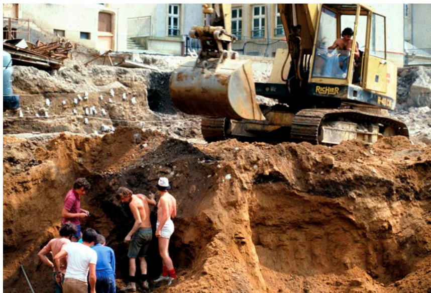
4 - Une course de vitesse inégale et désespérée des fouilleurs face aux pelleteuses (sauvetage urgent des Hauts-de-Sainte-Croix, Metz, juin-juillet 1983).

des III e -II e s. av. J.-C.), les délais deviennent difficiles à tenir. Les conditions de fouille se dégradent du fait qu'une entreprise de terrassement ne respecte pas les accords conclus. Le groupe initial est rejoint par une équipe de préhistoriens déterminés. Le conflit larvé avec l'aménageur se radicalise : accepter de nouveaux compromis ne conduit-il pas à cautionner la destruction de la bourgade gauloise à l'origine de la ville romaine, sans pouvoir l'étudier ?