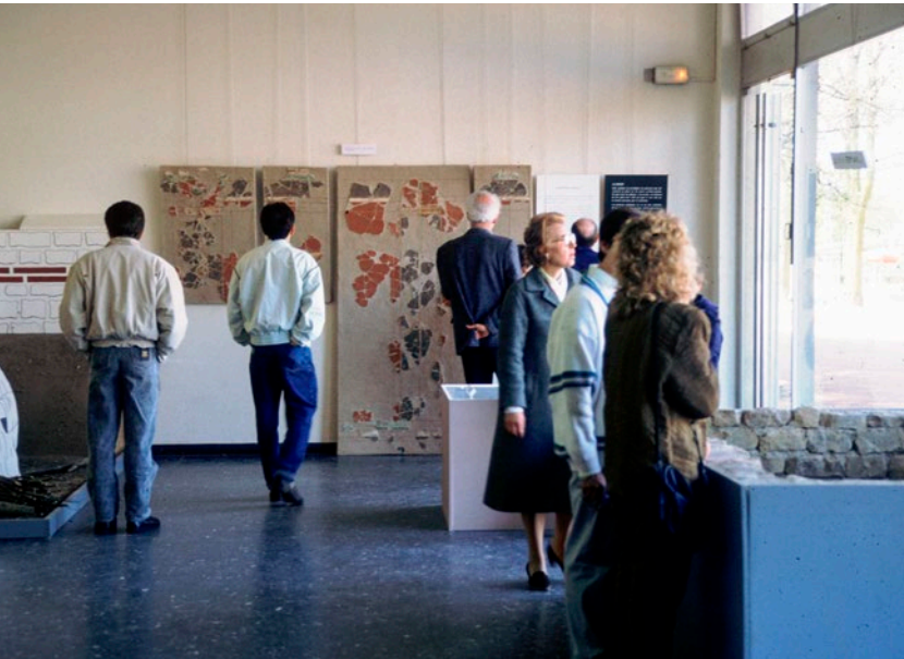
6 - L'information du public est une priorité : visiteurs de l'exposition Le passé du futur montée notamment par des membres du GUMRA illustrant dix années de fouilles urbaines (École des Arts appliqués, Metz, 1988).