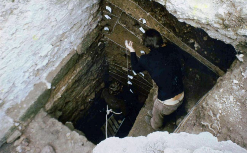
1 - Relevé d'une stratigraphie d'époque romaine, de 4,50 m d'épaisseur par deux bénévoles (sauvetage urgent de l'église Saint-Livier, Metz-Pontiffroy, 1978).