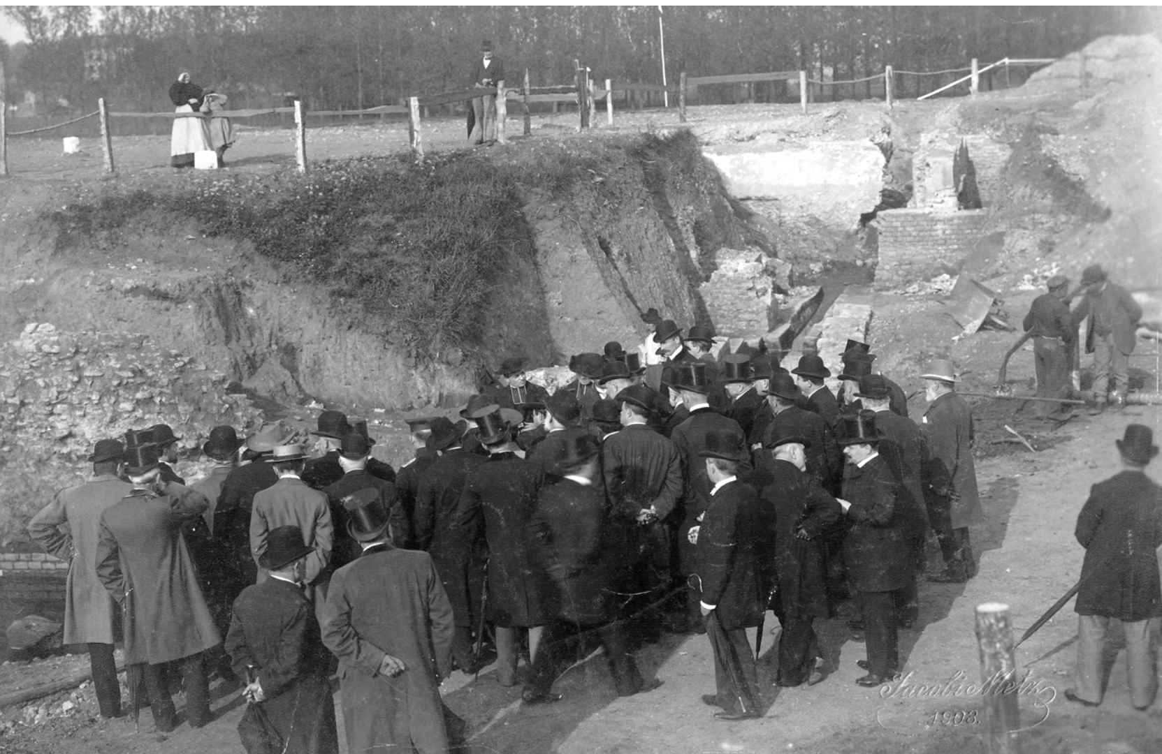
4 - Membres de la SHAL visitant les fouilles de l'amphithéâtre gallo-romain de Metz en 1903.

sont rares. Cette nécropole a livré la plus ancienne croix monumentale mérovingienne de Gaule, une croix pattée de type latin haute de 0,45 m (rens. : www.sahla.fr ). Plusieurs nécropoles ont été fouillées sur cette partie du territoire mosellan dont celle très bien étudiée de Metzervisse-Stuckange présentée au musée de la Tour aux Puces à Thionville ( www.tourauxpuces.com ).