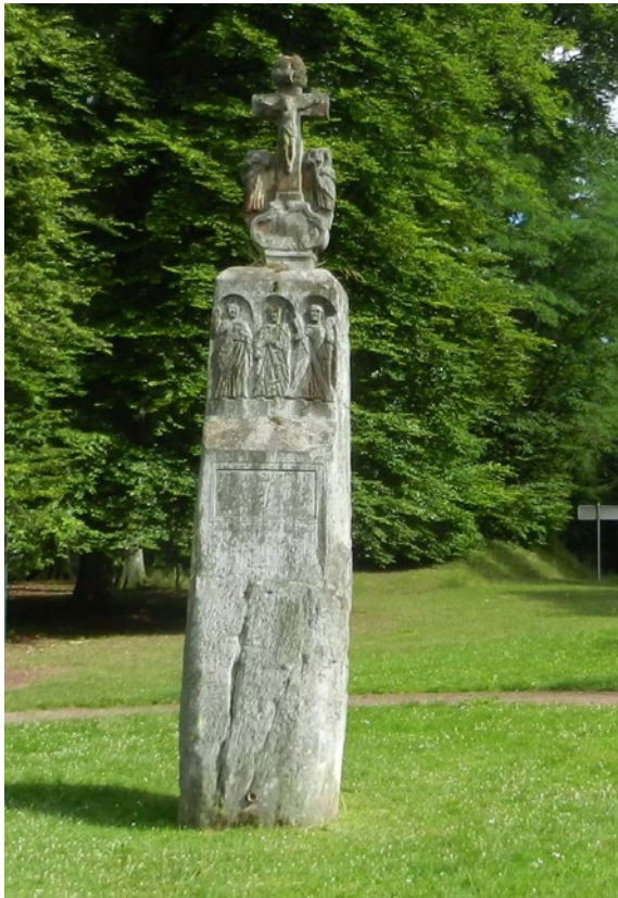
1 - La Pierre des douze Apôtres à Meisenthal, à l'intersection de trois routes ; l'une venant de Goetzenbruck, l'autre d'Althorn et la troisième de Wingen-sur-Moder. Cl. J.-P. Petit.

Reinheim, à cheval sur la frontière franco-allemande, met en valeur une microrégion où se succèdent un site princier celtique et un pôle urbain gallo-romain. La tombe de la dame de Reinheim (datée du début du IV e s. av. J.-C.), l'une des plus prestigieuses du monde celtique, a fait l'objet d'une reconstitution. À l'époque romaine, une petite ville, dont le visiteur découvre les vestiges du centre public (en particulier de thermes monumentaux) et des quartiers artisanaux, partage la vallée de la Blies avec une grande villa de notable au plan caractéristique et qui a été partiellement restituée in situ . Au sein de ce vaste parc, visitable aussi à travers un parcours numérique, plusieurs espaces muséaux présentent les collections issues des fouilles. (rens. : 03.87.02.25.20 ; www.archeo57.com).