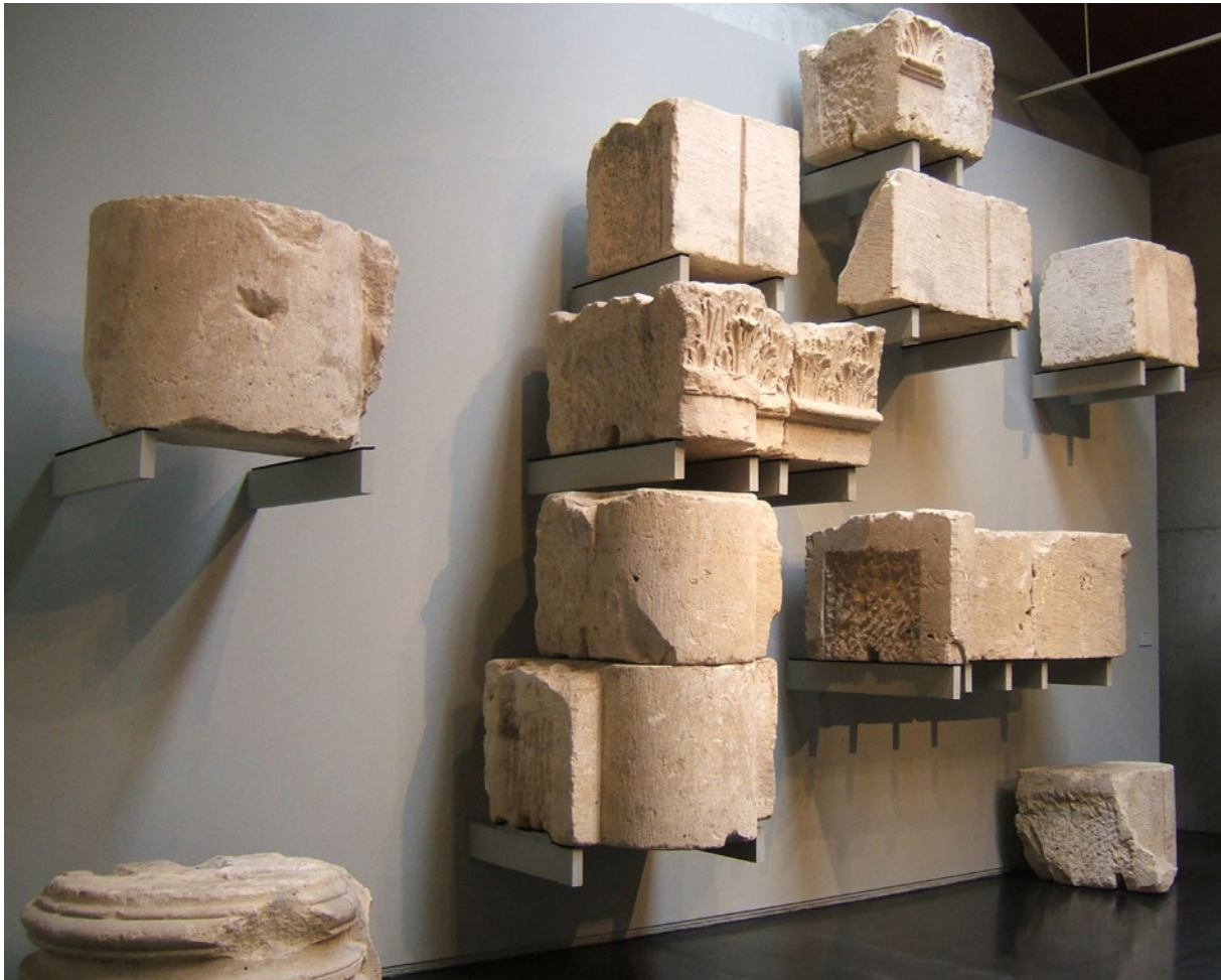
3 - Eléments architecturaux antiques mis au jour à Tarquimpol et conservés au musée du Pays de Sarrebourg.

Plusieurs villas, type d'établissement qui pendant longtemps a été considéré comme le marqueur principal des campagnes romaines, sont visibles en Moselle. La plus grande, celle de Saint-Ulrich, à Dolving, fouillée à la fin du XIX e s. puis entre 1963 et 1980, correspond à la résidence d'un notable établi non loin de l'antique Sarrebourg, Pons Saravi . Les vestiges de la résidence, seulement visible aujourd'hui depuis l'extérieur de la clôture qui ferme le site, se caractérisent par un très grand secteur balnéaire. Cette villa, située à proximité du couvent de Saint-Ulrich devenu un centre de rencontres musicales de renommée internationale, s'inscrit dans environnement naturel protégé. Les collections des fouilles, en particulier de somptueux enduits peints, sont visibles au musée de Sarrebourg.