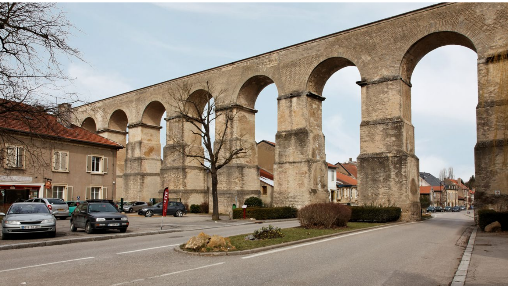
2 - Pont-aqueduc gallo-romain à Jouy-aux-Arches.

a été fortifiée dans l'Antiquité tardive. Au hasard de votre promenade dans le village et sur la presque île vous découvrirez quelques vestiges de cette agglomération-sanctuaire (éléments architecturaux, chapiteaux de colonne...) le long des rues ou devant les maisons, ou des stèles en remploi dans l'église sous laquelle a été fouillée au XIX e s. une nécropole mérovingienne. La topographie des lieux révèle l'emplacement du théâtre sur la presque île et permet de suivre le tracé du rempart qui ceint une superficie de 12 ha. Des collections issues des fouilles sont présentées au musée de Sarrebourg (rens. : 03.87.08.08.68 ; https://www.sarrebourg.fr/plan/musee-du-pays-de-sarrebourg ), en particulier des éléments architecturaux provenant d'un monument public ainsi qu'un