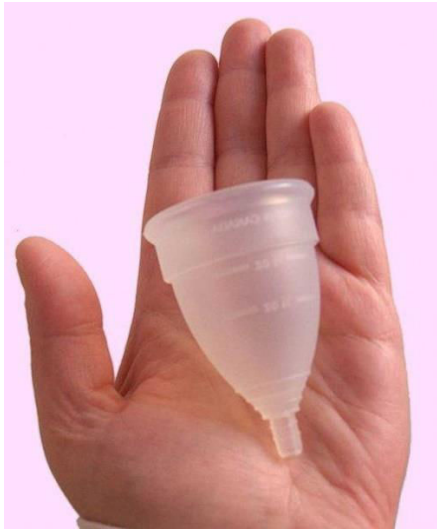
Figure 2 - Coupe menstruelle