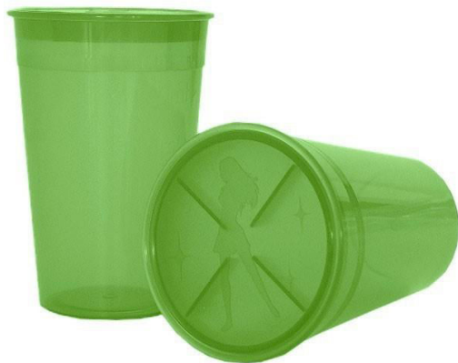
Figure 3 - Stérilisateur pour coupe menstruelle de marque "Meluna®"