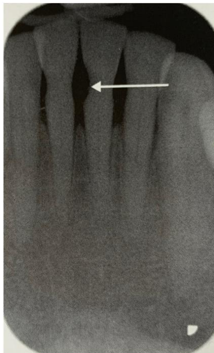
Figure 4 : radiographie rétro-alvéolaire de dents ayant subi des surfaçages réguliers (source : Charon, 2017)

Un des rôles du cément est former une barrière entre la dentine et le desmodonte, l'os alvéolaire ou le tissu conjonctif gingival. En l'éliminant par surfaçage systématique, nous pouvons parfois observer des phénomènes de résorption radiculaire avec une ablation des tissus durs de la racine. Les racines peuvent alors apparaître en « trognon de pomme » (Charon, 2017).