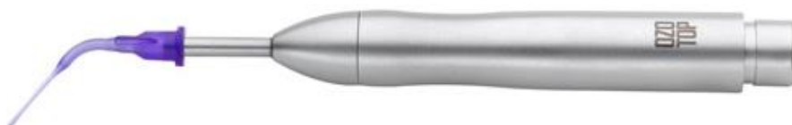
Figure 6 : exemple d'une pièce à main munie d'un capuchon d'étanchéité pour une utilisation parodontale