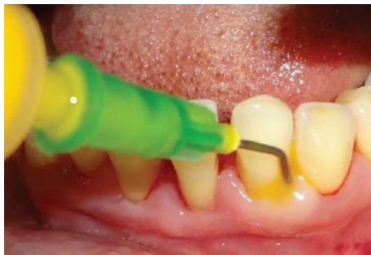
Figure 19 : application au sein d'une poche parodontale : on insère d'abord la seringue à la base de la poche parodontale puis on libère le gel tout en remontant jusqu'au bord gingival (source : Kadir et coll., 2017)

Des études réalisées chez l'Homme ont montré une carence en coenzyme Q 10 chez les patients ayant une gencive inflammatoire (Littarru et coll., 1971 ; Hansen et coll., 1976).