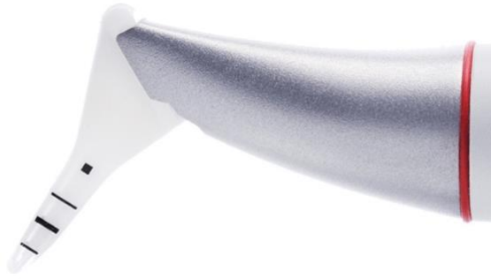
Figure 12 : busette Perioflow®

En plus d'une meilleure accessibilité aux poches parodontales, la nouvelle busette permet une diminution de pression, réduisant le risque de dommages des tissus gingivaux (Moëne et coll., 2010).