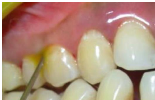
Figure 18 : application intra-sulculaire à l'aide d'une aiguille d'irrigation qui libère le gel dans le sulcus (source : Kadir et coll., 2017)