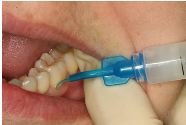
Figure 7 : irrigation d'une poche parodontale avec de l'eau ozonée

Son utilisation peut se faire sous différentes formes : en bain de bouche, en spray, en tant qu'irrigant dans une seringue ou dans le réservoir d'eau des ultrasons (Saraswathi et coll., 2016).