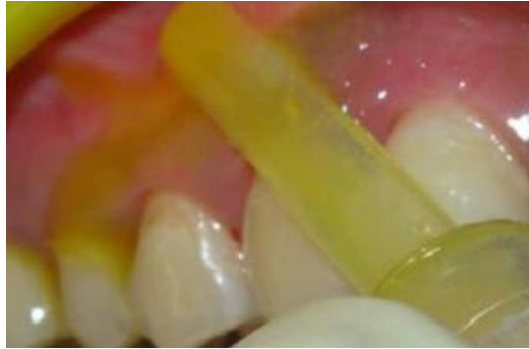
Figure 17 : application topique, avec la pointe d'un applicateur complètement imbibée de gel à appliquer sur le sextant assigné