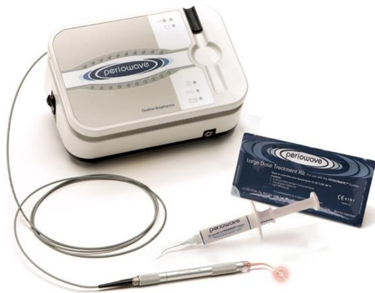
Figure 9 : exemple d'un système utilisant la thérapie photodynamique, Periowave®

Ainsi, l'agent photosensibilisant est placé directement dans la poche parodontale à l'aide d'une seringue où il doit rester 2 minutes, puis il est irradié à l'aide d'une fibre optique de petit diamètre introduite directement dans la poche parodontale durant 1 minute (Khandge et coll., 2013).