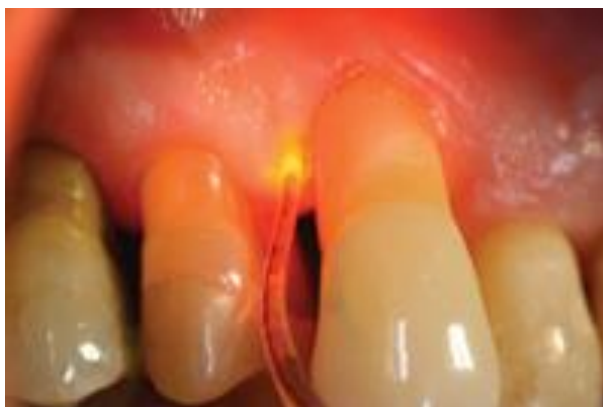
Figure 11 : irradiation à l'aide d'un laser