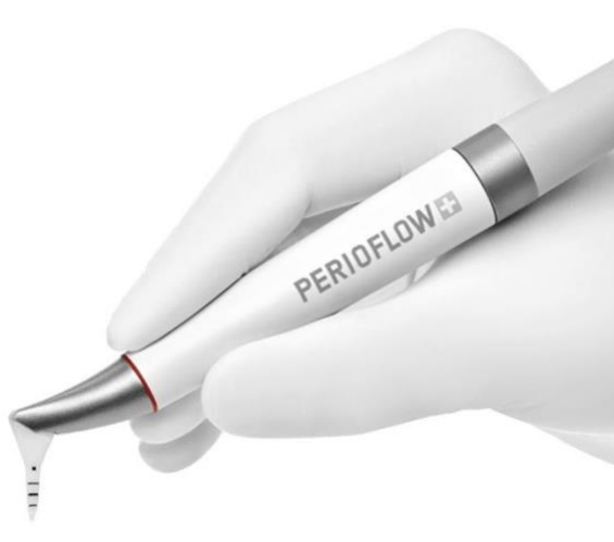
Figure 13 : Pièce à main Perio-flow® de EMS pour la réalisation d'un aéropolissage sous-gingival (source : EMS, disponible sur : www.ems-dental.com/fr )

En plus d'une meilleure accessibilité aux poches parodontales, la nouvelle busette permet une diminution de pression, réduisant le risque de dommages des tissus gingivaux (Moëne et coll., 2010).