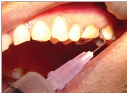
Figure 15 : application d'un gel d'aloë vera directement au sein d'une poche parodontale

L'aloë vera peut être utilisé sous différentes formes : en dentifrice, en bain de bouche, en gel, ou encore en jus (Bhat et coll., 2011).