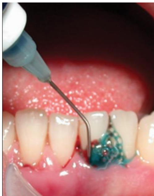
Figure 10 : mise en place de l'agent photosensibilisant au sein des poches parodontales

Ainsi, l'agent photosensibilisant est placé directement dans la poche parodontale à l'aide d'une seringue où il doit rester 2 minutes, puis il est irradié à l'aide d'une fibre optique de petit diamètre introduite directement dans la poche parodontale durant 1 minute (Khandge et coll., 2013).