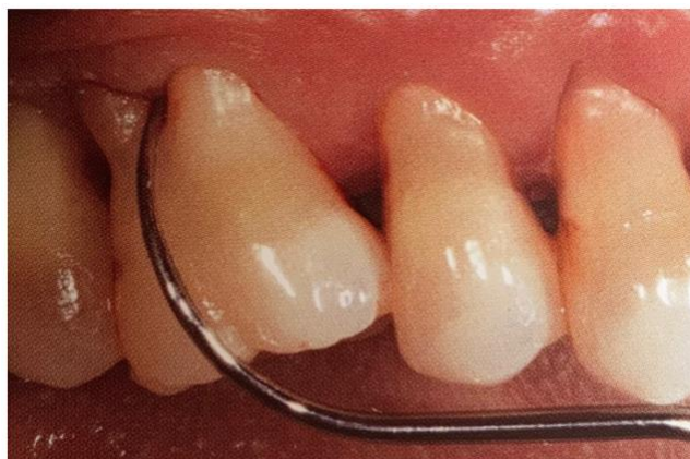
Figure 2 : mise en évidence d'une atteinte de furcation avec une sonde de Nabers

Le traitement parodontal non chirurgical est efficace pour prévenir l'évolution de l'atteinte inter-radiculaire des dents ayant une atteinte de furcation de classe I. Cependant, plus la lésion inter-radiculaire progresse, plus la perte d'attache est importante. Le traitement est donc moins performant avec des atteintes de furcation de classe II et III, notamment avec une élimination incomplète du tartre et une incapacité du patient à accéder et à nettoyer de manière optimale la zone de furcation (Huynh-Ba et coll., 2009).