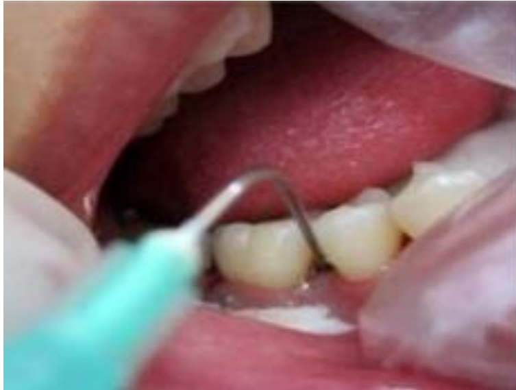
Figure 8 : application sous-gingivale d'huile d'olive ozonée avec une seringue