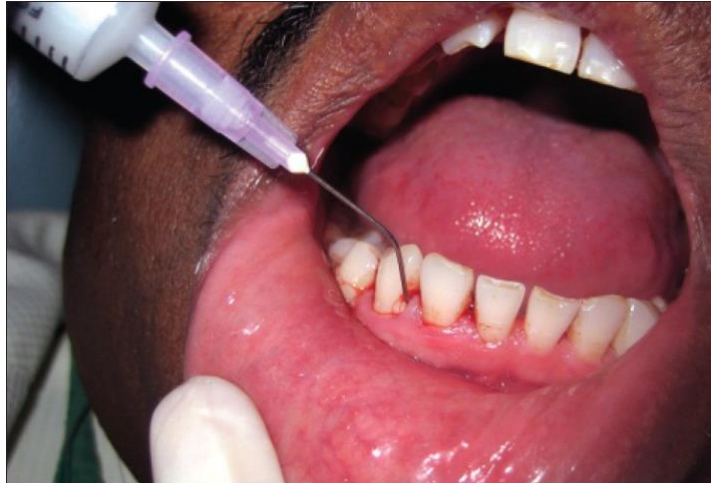
Figure 16 : mise en place d'un gel d'huile essentielle de citronnelle au sein des poches parodontales

Les paramètres cliniques : l'indice gingival, la profondeur de sondage et le niveau d'attache ont été évalués au début de l'étude, puis à 1 et 3 mois.