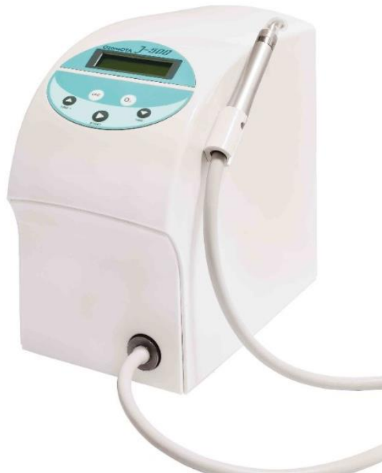
Figure 5 : exemple d'un générateur d'ozone produisant de l'ozone gazeux, G1000 de Apoza

Il peut être utilisé sous cette forme durant la séance de traitement initial après la réalisation du détartrage et du surfaçage. Différentes marques proposent des appareils capables de produire de l'ozone gazeux. Ces appareils sont munis d'une pièce à main sur laquelle est positionné un capuchon d'étanchéité à usage unique dont la morphologie est étudiée afin de pénétrer au sein de la poche parodontale (Gupta et Mansi, 2012).