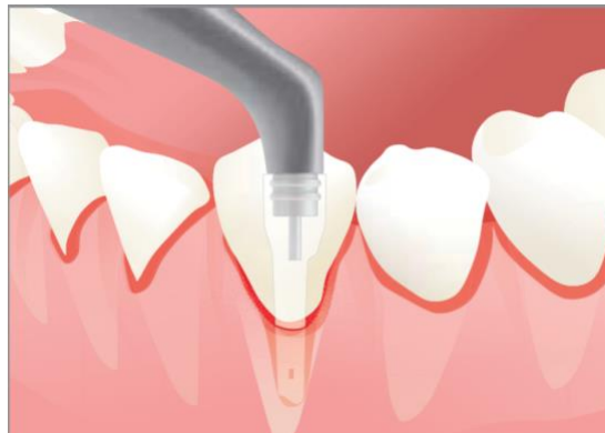
Figure 14 : insertion de la busette au sein d'une poche parodontale

Elle est insérée jusqu'à ressentir une résistance, puis légèrement reculée de la base de la poche pour laisser au moins 3 mm de distance avec l'os. Le système est ensuite activé et la busette est déplacée sur toute la surface de la racine par un mouvement circulaire de 5 secondes par surface (Moëne et coll., 2010).