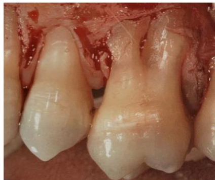
Figure 3 : présence de concavités et de racines fusionnées sur une molaire

Le praticien doit attribuer une importance appropriée à la morphologie radiculaire lors du traitement afin de ne pas négliger ces zones.