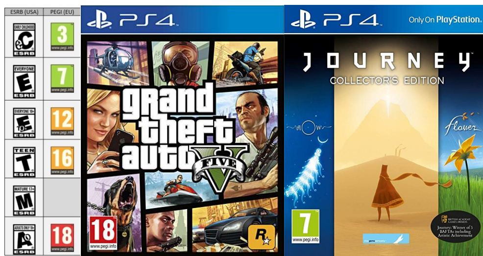
Figure 2.a. (à gauche) Pictogrammes ESRB et PEGI, 2.b. (centre) et 2.c. (droite) : deux exemples de jeux aux classement PEGI différents

Pour clore ce débat, on peut relever qu'il est étonnant que la question de la violence des jeux chez les mineurs soit en premier plan quand on sait que les jeux vidéo violents sont généralement interdits aux moins de 18 ans.