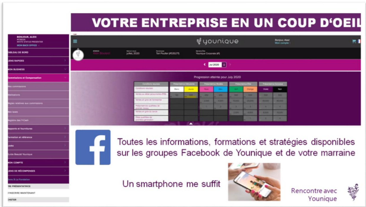
Figure 3. Capture d'écran du PowerPoint utilisé lors de la réunion

général. Armées d'un PowerPoint, les trois vendeuses ont ensuite présenté la société Younique, ses produits phares, ainsi que le système de vente (comment fonctionne la vente directe et la rémunération, comment sont formées les vendeuses qui décident de rejoindre...).