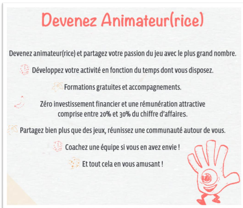
Figure 1. Captures d'écran du site internet de Cookies and Games