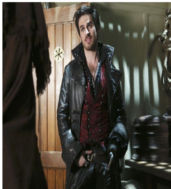
Figure n°4 : Crochet des temps modernes, Colin O'Donoghue dans la série Once upon a time d'Adam Horowitz (2011)