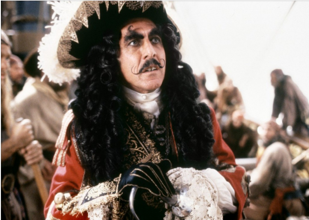
Figure n°9 : Le Capitaine Crochet incarné par Dustin Hoffman dans le film Hook de Steven Spielberg (1991)