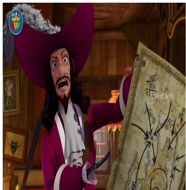
Figure n°7 : Un Crochet pour les plus grands, Les Nouvelles Aventures de Peter Pan d'Augusto Zanolello (2012)