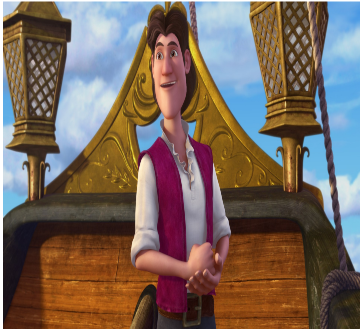
Figure n°5 : James Crochet avant d'être Crochet dans le film d'animation Clochette et la fée pirate de Peggy Holmes (2014)