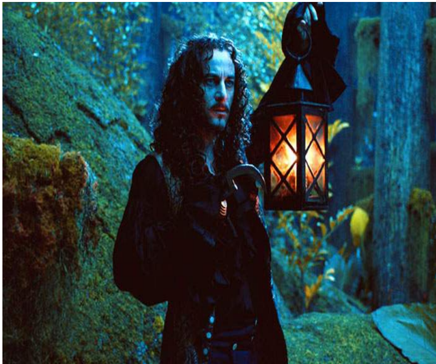
Figure n°9 : Jason Isaacs incarnant Crochet dans le film de P.J. Hogan, Peter Pan (2003)