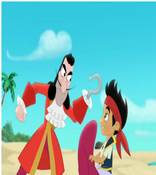
Figure n°6 : Un Crochet édulcoré dans Jake et les pirates du Pays Imaginaire des studios Disney (2011)