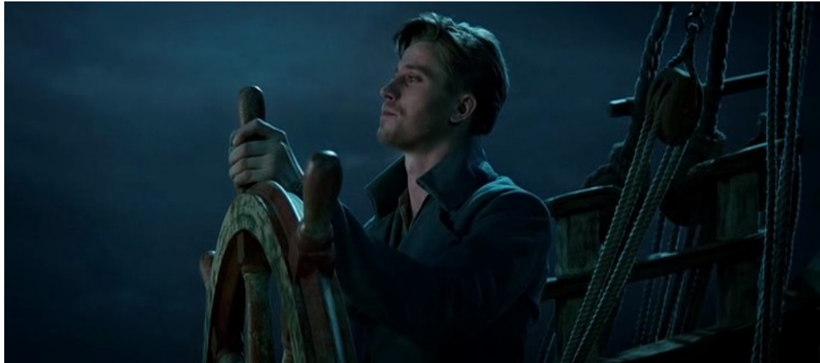
Figure n°8 : Crochet sans crochet, Garrett Hedlund dans le film Pan de Joe Wright (2015)