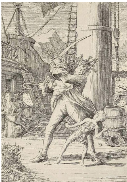
Figure n°1 : Le Capitaine Crochet illustré par Charles Scribner II pour la parution en roman de Peter and Wendy de James Matthew Barrie (1912)

Bienvenue à la galerie de personnages ! Voici les différentes représentations du Capitaine Crochet suivant les adaptations :