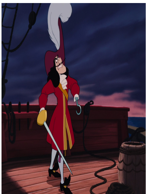
Figure n°3 : Le Capitaine Crochet vu par les studios Disney en 1953 dans le film d'animation Peter Pan