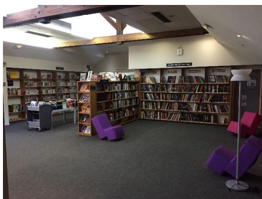
L'espace Bandes Dessinées