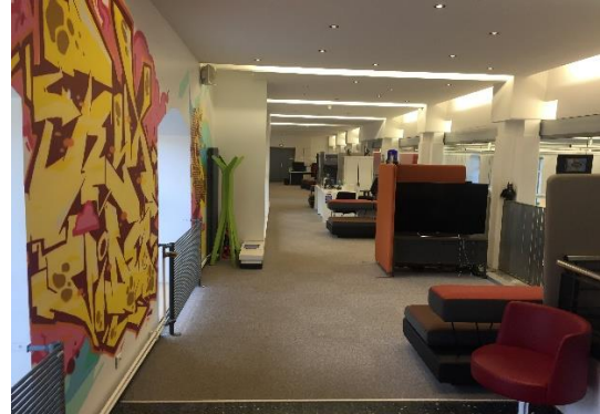
L'espace jeux vidéo