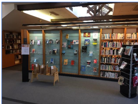
Mur de présentation et présentoir Kraft