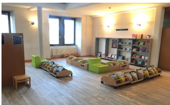
Le coin des tout-petits