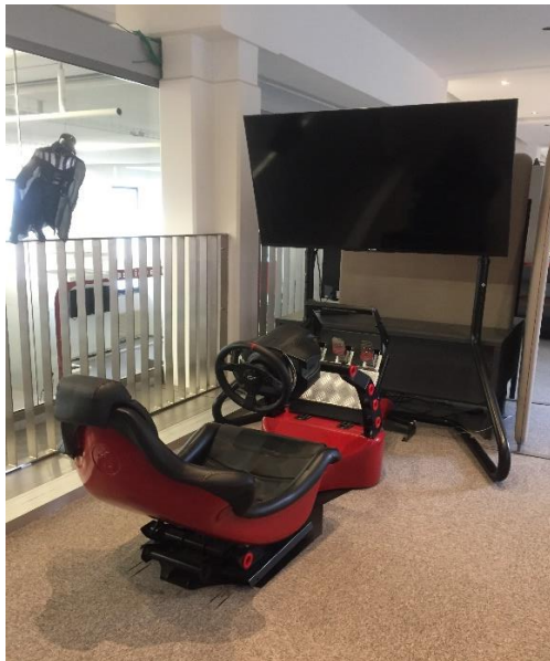
Le siège baquet