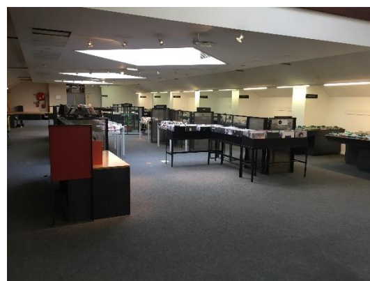
L'espace Image & Son