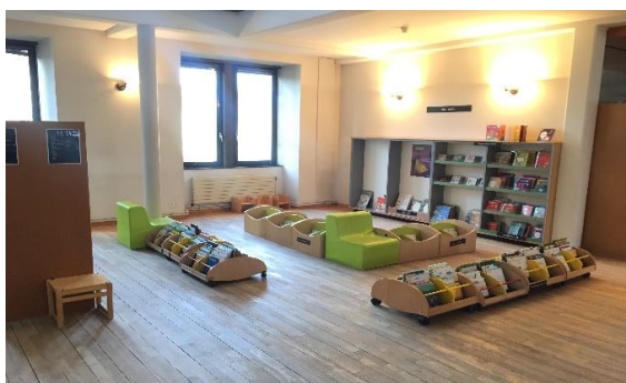
Le coin des tout-petits