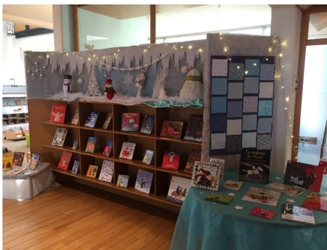
Le mur de présentation