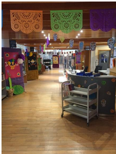
La banque de prêt