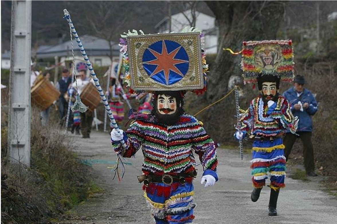
Figure 9 - Boteiros de Vilariño de Conso. Photographie de La Región