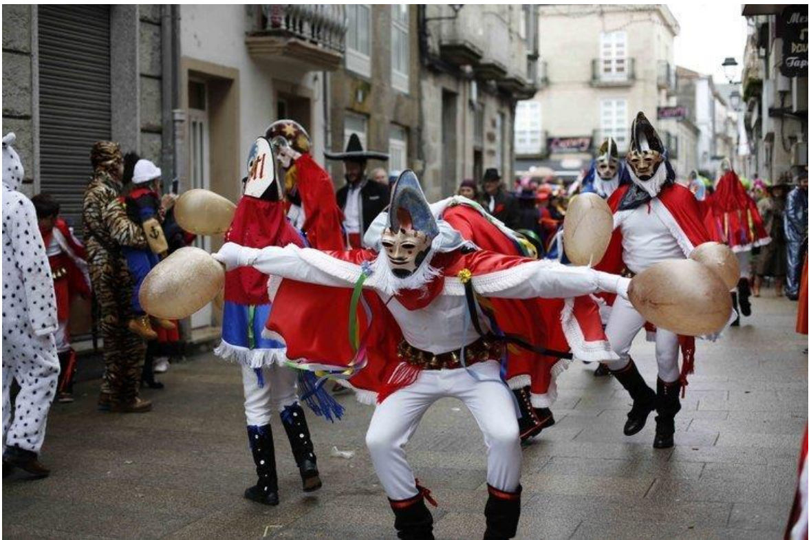
Figure 6 - Pantallas de Xinzo de Limia. Photographie de Diario Atlántico