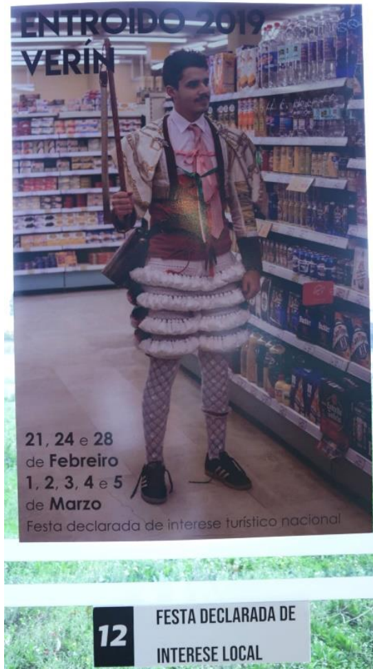
Figure 2 - Affiche candidate pour l'édition 2019 d'Entroido à Verín

plus fortes ont été faites à Verín. Lors du concours d'affiches pour l'édition 2019, une candidate a présenté l'affiche suivante :