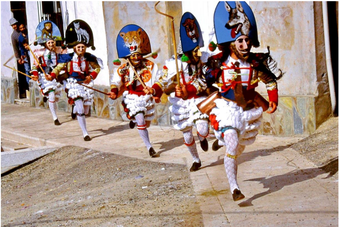
Figure 5 - Peliqueiros de Laza.