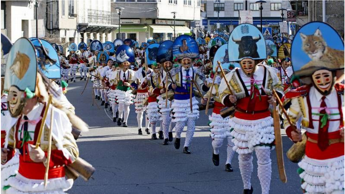
Figure 7 - Cigarróns de Verín.