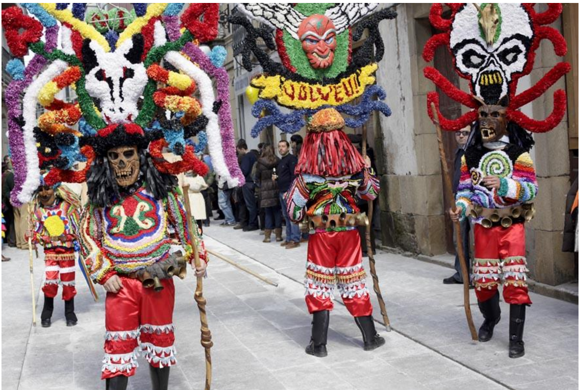
Figure 8 - Boteiros de Viana do Bolo.