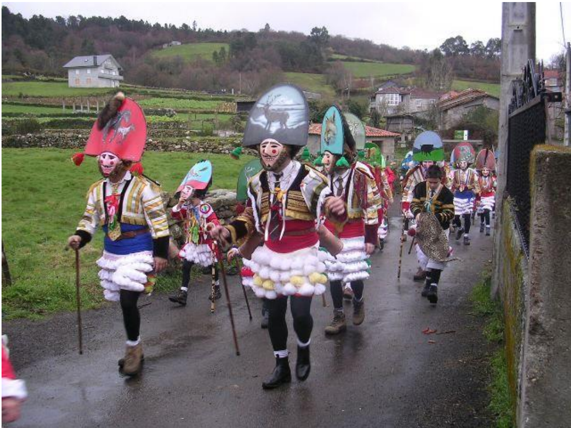
Figure 10 - Felos de Maceda.