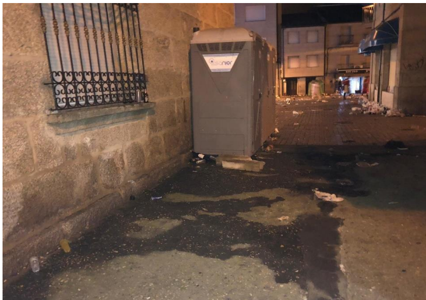
Figure 3 - La place García Barbón après la nuit de Xoves de Comadres. Photographie de Diario do Tamega. Ibib.

Ce même article est accompagné de photos prises avant que les agents d'entretien, qui ont par ailleurs eu besoin d'une pelleteuse, ne ramassent les déchets. La place remplie en effet de poubelle, mais des photos plus marquantes de trace d'urines à côté des toilettes chimiques, installées expressément pour combattre cela, où dans les entrées de bâtiment. Les mots du maire concentrent toute la colère que les habitants de Verín ressentent envers la désappropriation de leur fête. Cette soirée du jeudi a été créée dans un élan de féminisme pour honorer les femmes. Aujourd'hui par les effets de la massification, elle s'est convertie en un rendez-vous pour un tourisme de l'ivresse attirant chaque année plus de monde et créant un cercle vicieux qui dénature toute l'essence d' Entroido . Le problème prend d'autant plus d'ampleur quand on sait que ce phénomène est en train de se contagier aux autres jours d' Entroido .