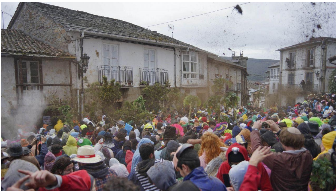
Figure 1- La place de la Picota lors de As Formigas.

reparto da cachucha . De la tête de porc fumée puis cuite, est distribué avec du pain, ponctuant la fin de la journée. C'est une distribution qui s'inscrit dans la tradition carnavalesque, celle de la consommation de viande avant le carême, et sa gastronomie, à base de porc, de chorizo et de cocido . Mais aussi dans la dépravation liée à cette période, puisque la cachucha , très grasse, est mangée avec les mains, sans regard pour l'hygiène, et que les restes osseux sont jetés dans la foule pour que celle-ci finisse de les nettoyer avec les mains.