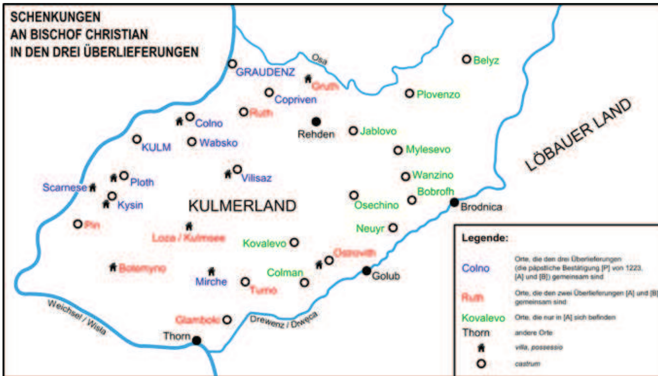
Karte: Schenkungen an Bischof Christian in den drei Überlieferungen