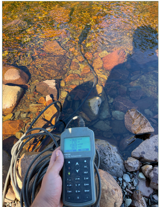
Figure 5 : Mesures physico-chimiques réalisées avec une sonde multiparamétrique Hanna HI 98194 (ruisseau de la Belle Rivière). 25 juin 2021.

influencent le cours d'eau (écorégion, typologie de la rivière, contexte physique et anthropique) afin de diviser le linéaire en tronçons homogènes. La division du cours d'eau en plusieurs tronçons permet de conduire la réalisation des mesures physico-chimiques, hydrauliques et les opérations de pêche. Pour évaluer la qualité physico-chimique des cours d'eau, une sonde multiparamétrique de terrain Hanna HI 98194 (Fig. 5) a été utilisée pour chaque tronçon. Cette sonde permet d'acquérir cinq paramètres : la température, le pH, l'oxygène dissous, la salinité et la conductivité. Ces paramètres ont été choisis car ils sont les plus importants pour l'espèce ciblée et permettent d'identifier les tronçons les plus propices au développement de l'omble de fontaine.