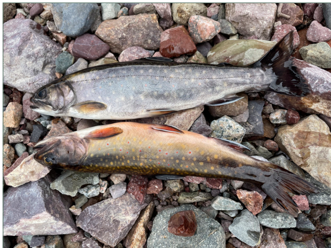
Figure 2 : Spécimens d'omble de fontaine de mer (grisée) et d'omble de fontaine de ruisseau (colorée) pêchés dans le ruisseau de la Mère Durand (île de Miquelon). Cliché Edgard Gustave, 9 juin 2021.

par la tourbe. Le climat est de type subarctique, adouci par l'influence océanique. Les étés sont particulièrement courts et frais (16,2°C en août) et les hivers froids (-3,2°C en février). La température moyenne annuelle est de 5,7°C.