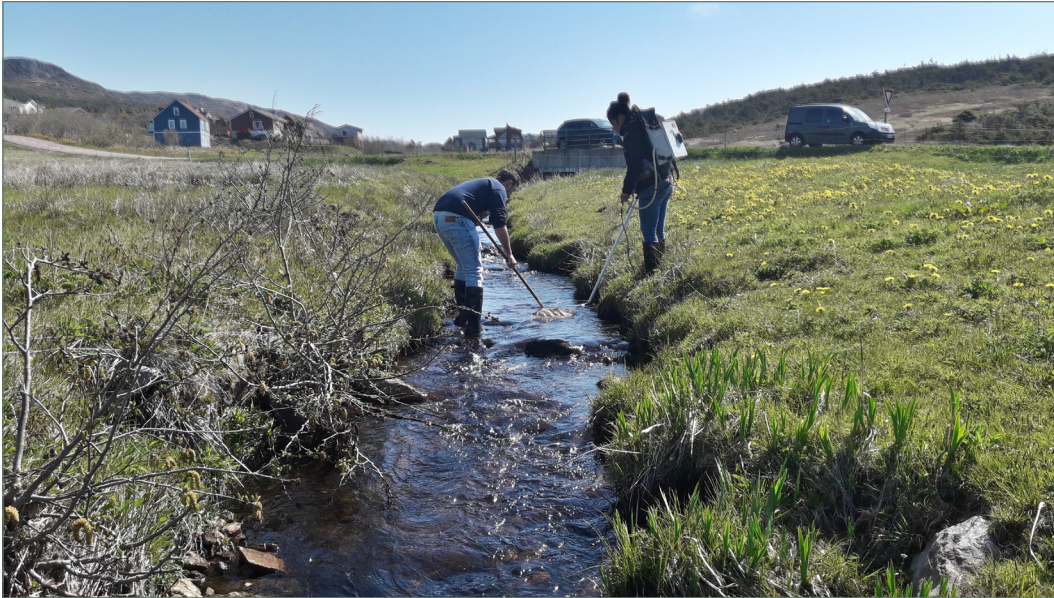
Figure 6 : Capture des poissons dans le ruisseau de Savoyard par pêche électrique (tronçon Qualphy n°55). Cliché Erwan Durand, 2 juin 2021.

noir et son degré d'intensité, présence ou non de copépode sur les nageoires et/ou branchies, prélèvements de nageoire adipeuse, etc.) a été récoltée sur les poissons échantillonnés.