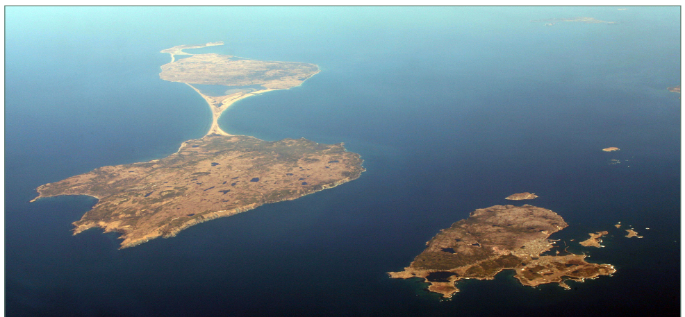
Figure 1 : L'archipel de Saint-Pierre et Miquelon vue d'avion. Cliché Doc Searls, 5 mai 2013

érodé laisse aujourd'hui apparaître des mornes (petites collines) dont les sommets s'élèvent à 207 m (le Trépied – île de Saint-Pierre), 240 m (morne de la Grande Montagne – île de Miquelon) et 190 m d'altitude (Cuquemel – presqu'île de Langlade). L'archipel de SPM se caractérise par une grande couverture d'étangs, connectés entre eux par un réseau dense de ruisseaux et rivières s'écoulant sur un substrat dominé