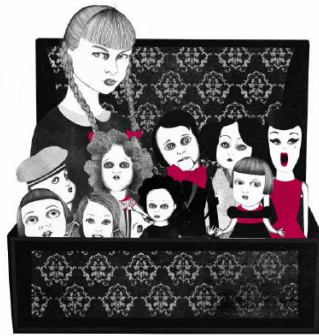
CUARTO DE JUGUETES