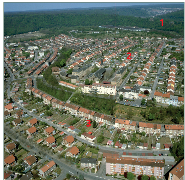
Figure 3 : Joeuf, une ville-usine paternaliste hiérarchisée

Le deuxième niveau de cette hiérarchie est symbolique et a une fonction de contrôle. La hiérarchie de l'entreprise est mise en scène dans l'espace. Par exemple, les châteaux patronaux sont souvent placés