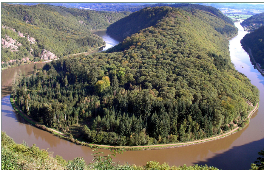
Figure 2 : Méandre encaissé de la Sarre à la Cloef (D. Harmand, 2012)

prime sous la forme de grottes et de cavités karstiques étagées sur les versants. Leur remplissage d'alluvions siliceuses, issues des Vosges, indique qu'il s'agit d'un karst sous-alluvial développé à partir de pertes sous le lit de la Moselle. L'âge U/Th d'un spéleo-thème d'une cavité de Pierre-la-Treiche (270 ka) précise l'âge ancien des karsts fossiles du Toulinois. Enfin, le troisième, localisé au sommet des côtes correspond avec un paléokarst à remplissage ferrugineux d'âge crétacé inférieur qu'il est possible d'observer dans le Pays-Haut, ou au sommet de la côte des Bars, à Poissons.