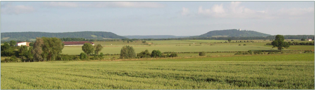
Figure 4 : Buttes-témoins du Loupmont et du Mont-Sec en inversion de relief dans un fossé d'effondrement, côte de Meuse (D. Harmand, 2008)

ou avant-côte des Eparges, défigurées par les entonnoirs de mines). L'un des sites les plus emblématiques est toutefois le Mont-Sec qui porte à son sommet le monument commémoratif de la victoire de l'armée américaine, lors de la réduction du saillant de Saint-Mihiel en 1918. La rotonde édifée en 1932 rehausse la valeur du géomorphosite, car, d'une part, elle est bâtie avec la Pierre d'Euville, formation de la côte de Meuse, et d'autre part, elle permet de repérer à plusieurs dizaines de kilomètres la butte-témoin (Fig. 4).