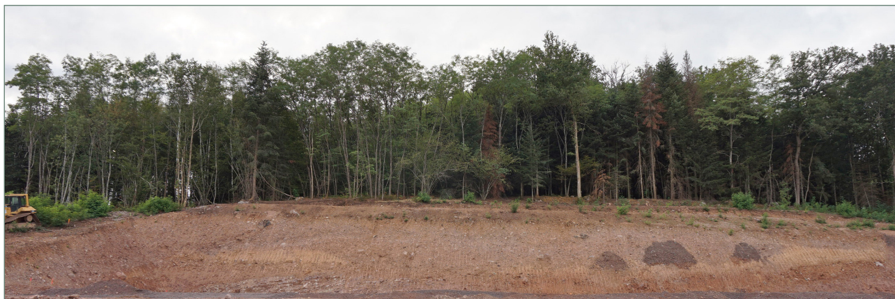
Figure 3 : Coupe de la moraine externe de Mélisey, Haute Saône, (D. Harmand, 2020)

Dans l'esprit du public, les géomorphosites ont souvent un intérêt secondaire qui l'emporte sur la valeur scientifique. Tel est le cas du karst actif de Grand, à l'ouest du département des Vosges, dont les galeries ont alimenté en eau une ville gallo-romaine prospère, ou des buttes-témoins d'intérêt stratégique sur lesquelles ont été bâties des fortifications, au Moyen-Âge (Mousson, Vaudémont, La Mothe), aux époques moderne (forteresse Vauban à Montmédy) et contemporaine (forts Séré de Rivières sur le Mont-Saint-Michel à Toul ou Bourlémont sur une avant-côte de Meuse). Certaines ont été des lieux de combat (butte-témoin de la côte d'Argonne à Vauquois,