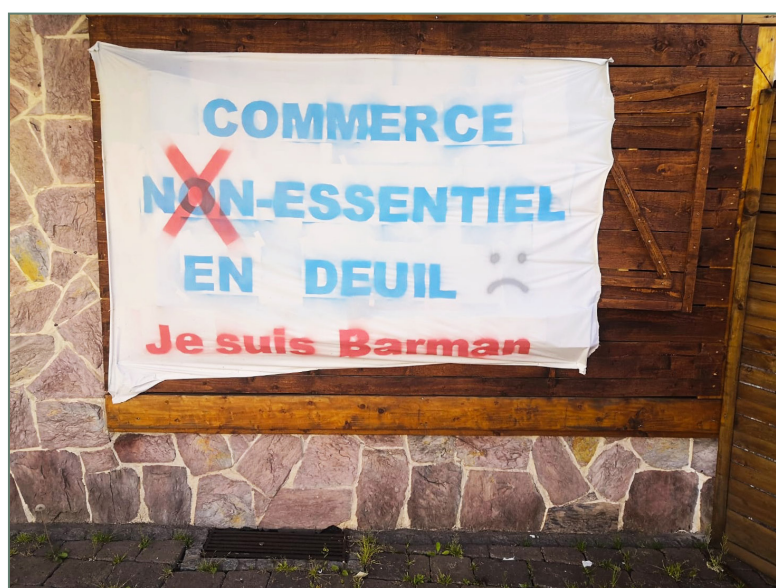
Figure 2 : Mécontentement voire colère d'un « barman » au centre de Bruyères (Vosges) fermé du 28 octobre 2020 au 19 mai 2021.

Le drive introduit par Auchan, en 2000 ainsi que le drive piéton plus tardif qui apporte, lui, l'offre d'un hypermarché en centre-ville ont été plébiscités durant toute la crise. Selon les données d'Iri, les ventes e-commerce des grandes surfaces alimentaires (drive et livraison à domicile) ont connu un bond de 46,5 % l'an dernier. De quoi atteindre 10 milliards d'euros (tous produits), dont 9 pour le drive et près de 10% de part de marché des PGC (Produits Grande Consommation) (LSA, 2021). « Le succès du drive pendant la COVID s'explique aussi par l'importance accordée au prix par des consomma-