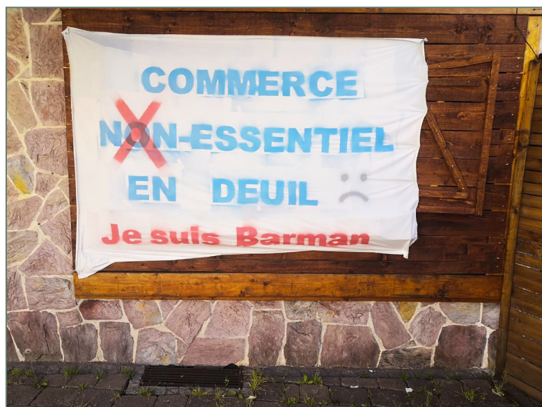
Figure 2 : Mécontentement voire colère d'un « barman » au centre de Bruyères (Vosges) fermé du 28 octobre 2020 au 19 mai 2021.

Le drive introduit par Auchan, en 2000 ainsi que le drive piéton plus tardif qui apporte, lui, l'offre d'un hypermarché en centre-ville ont été plébiscités durant toute la crise. Selon les données d'Iri, les ventes e-commerce des grandes surfaces alimentaires (drive et livraison à domicile) ont connu un bond de 46,5 % l'an dernier. De quoi atteindre 10 milliards d'euros (tous produits), dont 9 pour le drive et près de 10% de part de marché des PGC (Produits Grande Consommation) (LSA, 2021). « Le succès du drive pendant la COVID s'explique aussi par l'importance accordée au prix par des consomma-