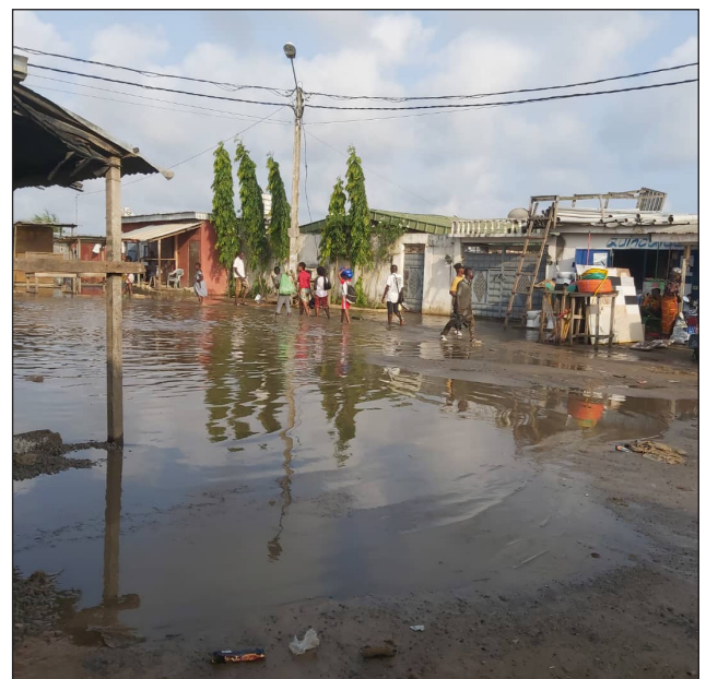
Figure 4 : Habitants du quartier de Gonzagueville à Port Bouët vaquant à leurs occupations malgré les inondations. Cliché K. Habal TRAORÉ, 16 juin 2021

Les précipitations menseuelles parfois élevées (650 mm en juin 2020 1 ) provoquent en plus des inondations, des glissements de terrain dans les secteurs prédisposés au phénomène. En effet, certaines zones sont soumises à une