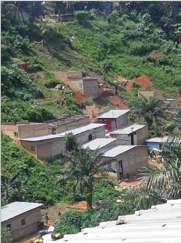
Figure 5 : Maisons situées sur des escarpements propices aux glissements de terrains à Abobo dans le quartier d'Akéikoi 17 juillet 2021

« instabilité des fortes pentes > 15% sur les sables argileux et sables argileux grossiers » (Andre, 2013). Les habitations défient les lois de la gravité en bordure des vallées, dans les zones de plateaux situés au nord de la ville. On pourrait prendre pour exemple certaines habitations dans les communes d'Attécoubé, Abobo (Fig. 5), Anyama et Yopougon dont l'emplacement laisse dubitatif quant au respect strict des normes d'implantation en matière de construction.