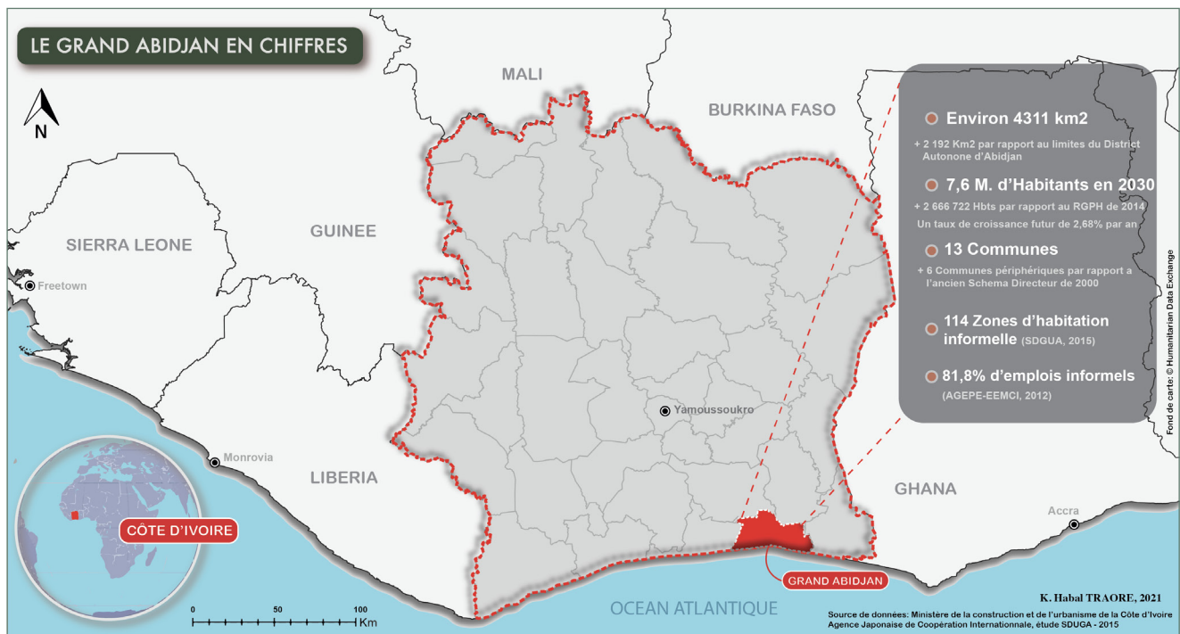
Figure 1 (cliquez sur la carte pour l'agrandir) : Le Grand Abidjan en Côte d'Ivoire. K. Habal TRAORÉ, 2021

De ce fait, l'imagerie satellitaire à haute résolution spatiale combinée avec un échantillonnage des états de surface réalisé sur le terrain est aujourd'hui un excellent moyen d'aborder la question de l'aménagement du territoire. Ce 4 pages fait état d'une méthodologie basée sur les traitements d'images, adaptée aux spécificités du territoire du Grand Abidjan. Dans ce cadre, des résultats ont été obtenus sur les surfaces bâties en 1984, 2000 et 2020.