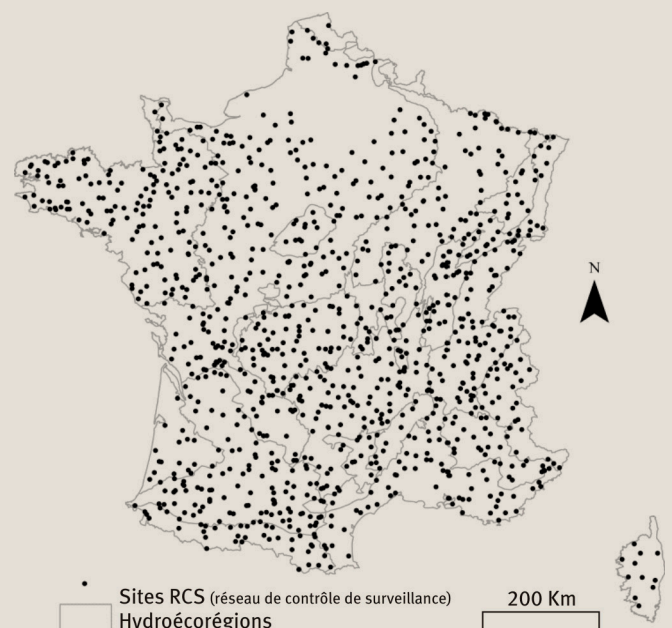
1 Carte des 1 200 sites du réseau de contrôle de surveillance sélectionnés.