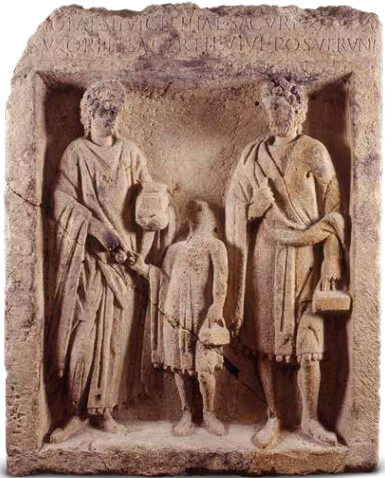
Fig. 2 Un exemple de stèle funéraire trouvée à Metz comparable à celles décrites par Ph. de Vigneulles en 1513.

mêmes de l'enceinte. Faites de « vieille antiquaille », « de grosse pier de tailles platte et cairée » celles-ci ont de quoi susciter l'étonnement. Aussi le chroniqueur en livre-t-il une description précise qui permet d'identifier des stèles funéraires gallo-romaines : les défunts apparaissent « avec leurs abis » et tiennent en main des attributs « de diverse forme et semblance » liés à leur profession ou à leur genre ( fig. 2 ). De fait, ces stèles qui fournissaient un matériau tout prêt avaient été, selon l'habitude, utilisées en remploi au moment de la construction du mur à la fin du III e siècle. À de nombreuses reprises dans l'histoire de la ville ont eu lieu de semblables découvertes, par exemple en 1973-1974. Alors, de même qu'en 1513, la construction du Centre Saint-Jacques mit au jour les fondations antiques faites de monuments funéraires gallo-romains.