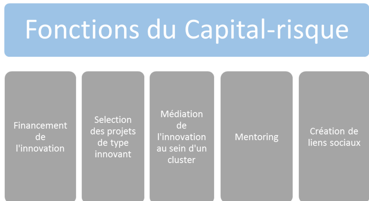
Figure 1 : Les différentes fonctions du capital risque