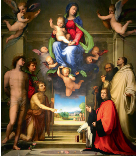
Fig. 1. FRA BARTOLOMEO, Retable dit de la Vierge aux saints, 1511-1512, BESANÇON, Cathédrale Saint-Jean