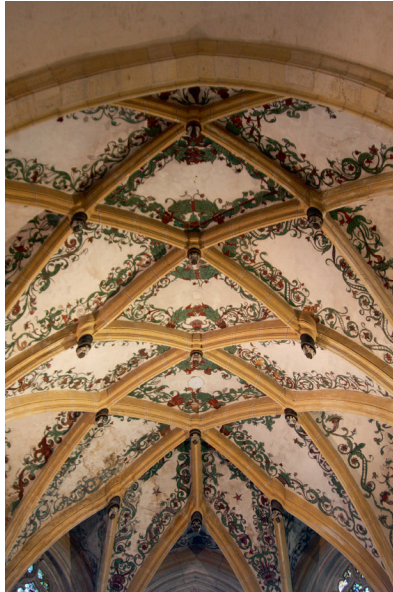
Fig. 4 : Voûte du chœur , vers 1526, MONTBENOÎT, Ancienne abbaye Notre-Dame