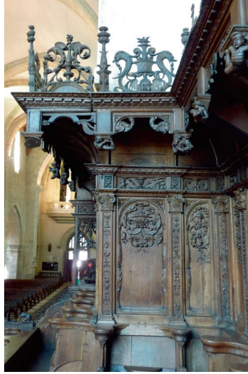
Fig. 5 : Stalles du côté de l'Évangile (détail), vers 1525-1527, MONTBENOÎT, Ancienne abbaye Notre-Dame