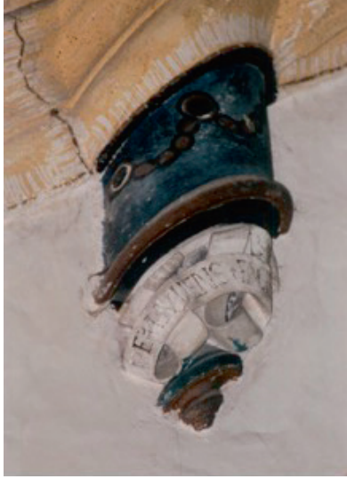
Fig. 3 : Clef de voûte signée Buyens , 1526, MONTBENOÎT, Ancienne abbaye Notre-Dame