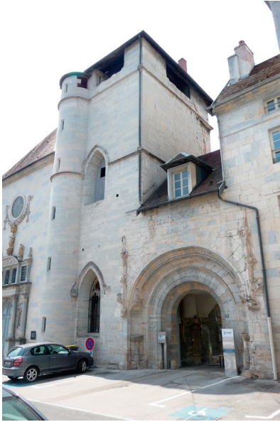
Fig. 6 : Clocher, chapelle de Notre-Dame de Pitié et porche, vers 1520-1530, BESANÇON, Ancienne abbaye Saint-Vincent