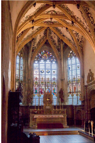
Fig. 2 : Vue du chœur, vers 1522-1526, MONTBENOÎT, Ancienne abbaye Notre-Dame