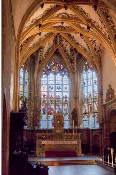
Fig. 2 : Vue du chœur, vers 1522-1526, MONTBENOÎT, Ancienne abbaye Notre-Dame