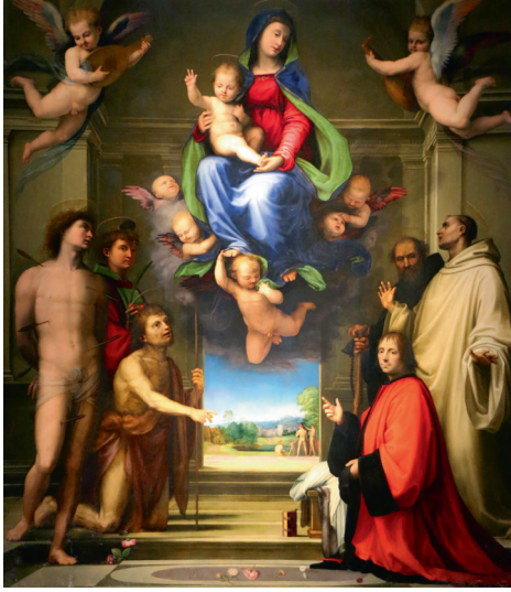
Fig. 1. FRA BARTOLOMEO, Retable dit de la Vierge aux saints, 1511-1512, BESANÇON, Cathédrale Saint-Jean