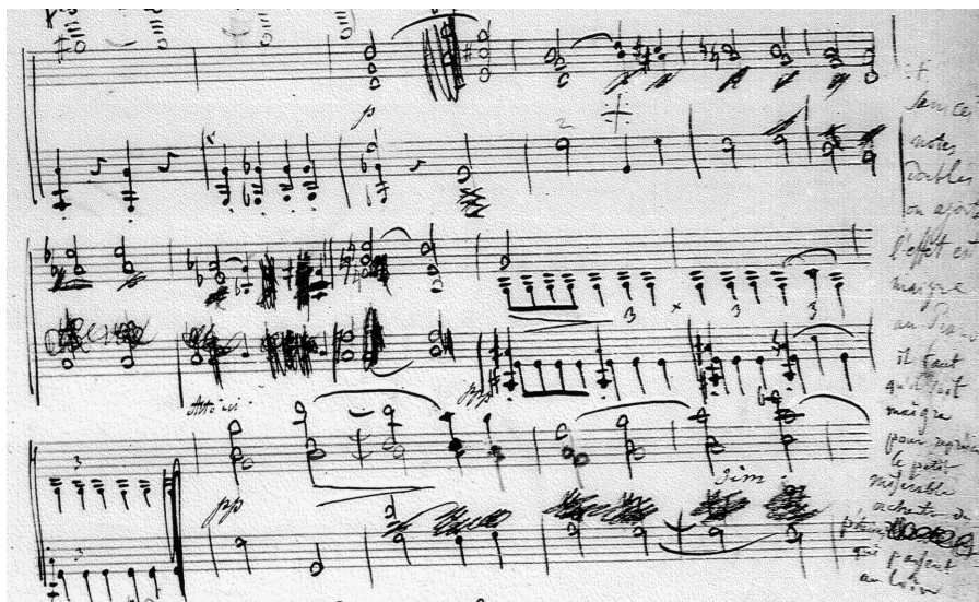
FIGURE 9 • Conversation sur un manuscrit (Liszt, Partition de piano d'Harold en Italie , manuscrit de Berlin, p. 76)

Cette « conversation » entre deux compositeurs en marge d'un manuscrit musical est un phénomène rare, le seul exemple dans le cadre de la collaboration entre Liszt et Berlioz 75 .