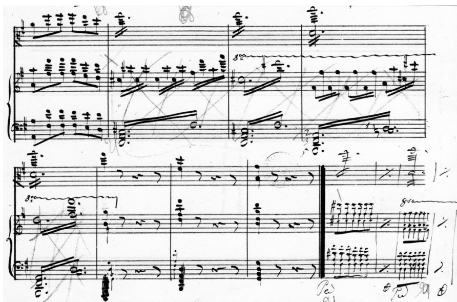
6.3) Liszt, Partition de piano d'Harold en Italie , manuscrit de Paris, p. 39

Sur le manuscrit de Paris, la dernière version du manuscrit de Berlin est mise au propre par le copiste, puis certains passages sont raturés et corrigés par Liszt; les corrections donnent alors la version finale publiée. Par exemple, pour les dernières mesures du premier mouvement, le manuscrit de Berlin contient deux versions : Liszt a hésité sur la meilleure manière de transcrire la tenue (en tutti et