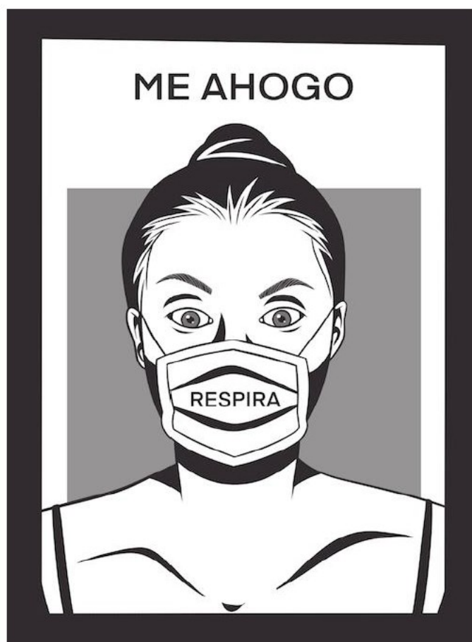
Imagen 3: Beh Sam, “Me ahogo”, Brevirus, antología de minificaciones , ed. Lilian Elphick Latorre, Santiago de Chile: Brevilla, 2020, p. 197. https://www.lettrasdechile.cl/home/images/pdf/brevirus_2020.pdf (consultado el 4/1/22)

En “ Take a pill! ”, María Elena Lorenzin se vale de referencias al contexto político-sanitario para elaborar un texto muy crítico hacia Donald Trump y su postura respecto a la pandemia. Burlándose de las declaraciones simplistas acerca de las supuestas virtudes de la hidroxiclороquina como protección contra la Covid-19 (ver, por ejemplo, Kruse 2020) el título abre un relato a cargo de un narrador extra-homodiegético, antiguo combatiente presuntamente invencible. Partidario de un expresidente a quien califica de “ terrific ” (40), retoma uno de sus adjetivos predilectos, cuya utilización en el sentido de “excelente” no borra la ambigüedad constitutiva (excelente/terrible). La misma ambivalencia del vocablo “tremendo” (“tremendo producto”) y el recurso a la metáfora de la “guerra contra un enemigo invivable” (ver, por ejemplo, Shafer 2020), ambos elementos de la retórica trumpiana, vienen a completar esta reescritura paródica de discurso en pro de Trump.