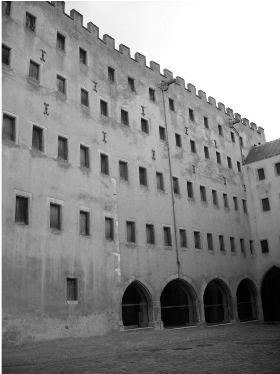
Figure 3 : Grenier de Chèvremont de Metz (1457-1459)