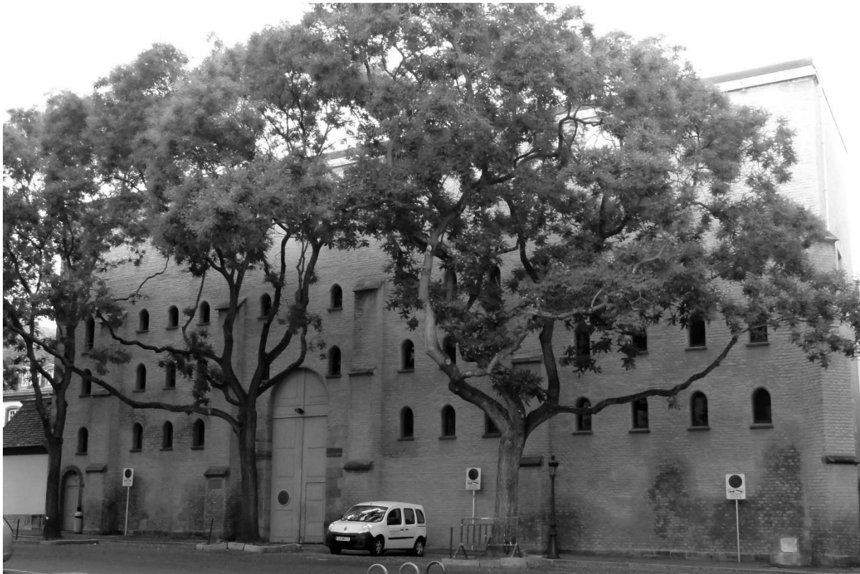
Figure 2 : Kornspeicher de Strasbourg (1441)