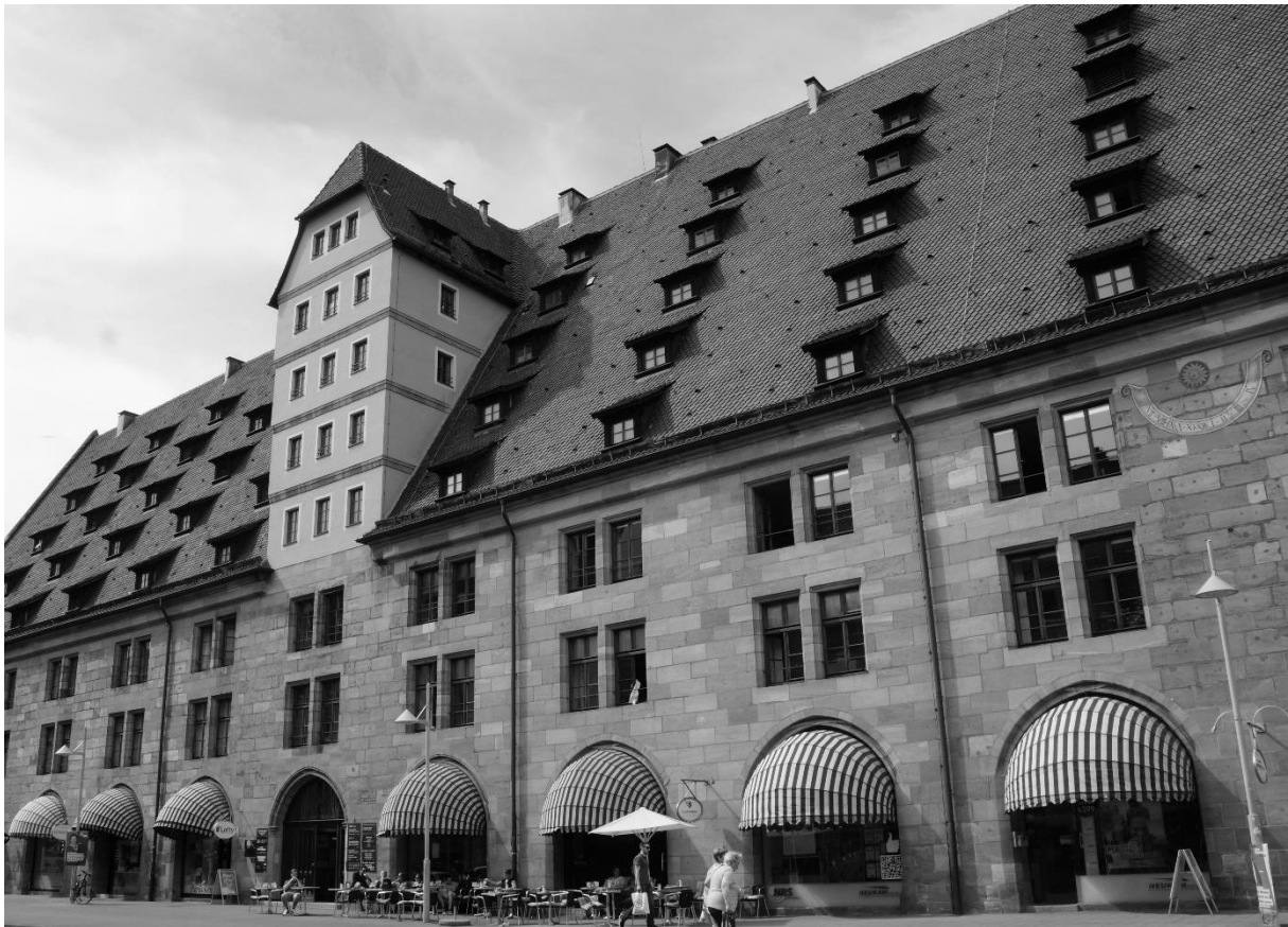
Figure 4 : Mauthalle de Nuremberg (1498-1502)

et 1490-1491 37 , la cité entreprend entre 1498 et 1502 la construction d'une immense réserve municipale – la Mauthalle – qui mesure 84 m de long sur 20 m de large et s'élève sur six niveaux (cf. figure 4) 38 . Ces bâtiments ne manquent pas de frapper l'imaginaire des contemporains : dans les cités d'Empire, ils sont considérés comme de véritables curiosités, systématiquement visitées par l'empereur lors de ses déplacements 39 .