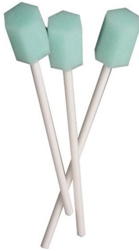
Figure 2 : Bâtonnets à embouts mousse ( période 1)

Puis après un temps de formation de l'équipe paramédicale, nous étudierons une seconde période durant laquelle les patients bénéficieront de soins de bouche alternant brossage des dents et soins de bouche, chacun avec aspiration des débris, solution antiseptique à base de chlorhexidine 0.5 % et hydratation. Durant cette période, nous utiliserons les consommables du kit Intersurgical © avec Orocare Sensitive ® et Orocare Aspire ® (Figure 3).