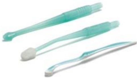
Figure 3: Kit Intersurgical (période 2)

Puis après un temps de formation de l'équipe paramédicale, nous étudierons une seconde période durant laquelle les patients bénéficieront de soins de bouche alternant brossage des dents et soins de bouche, chacun avec aspiration des débris, solution antiseptique à base de chlorhexidine 0.5 % et hydratation. Durant cette période, nous utiliserons les consommables du kit Intersurgical © avec Orocare Sensitive ® et Orocare Aspire ® (Figure 3).