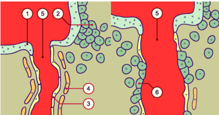
Illustration 1 : invasion progressive par les cellules cytotrophoblastiques de la caduque et des artères spiralées. [18]

A partir du 9 e jour pré-conceptionnel, le cytotrophoblaste envahit les vaisseaux maternels pour mettre en place un système d'échange performant entre la mère et l'embryon, c'est le développement du futur placenta. Pour cela, ce cytotrophoblaste endovasculaire détruit les cellules musculaires lisses et remplace les cellules endothéliales des artères spiralées maternelles. Au cours du 4 e mois, ces artères perdent de leurs pouvoirs en élasticité et empêche une bonne perfusion du fœtus.