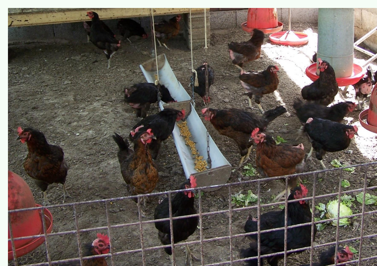
16 g/kg de PM Jondreville et al 2010