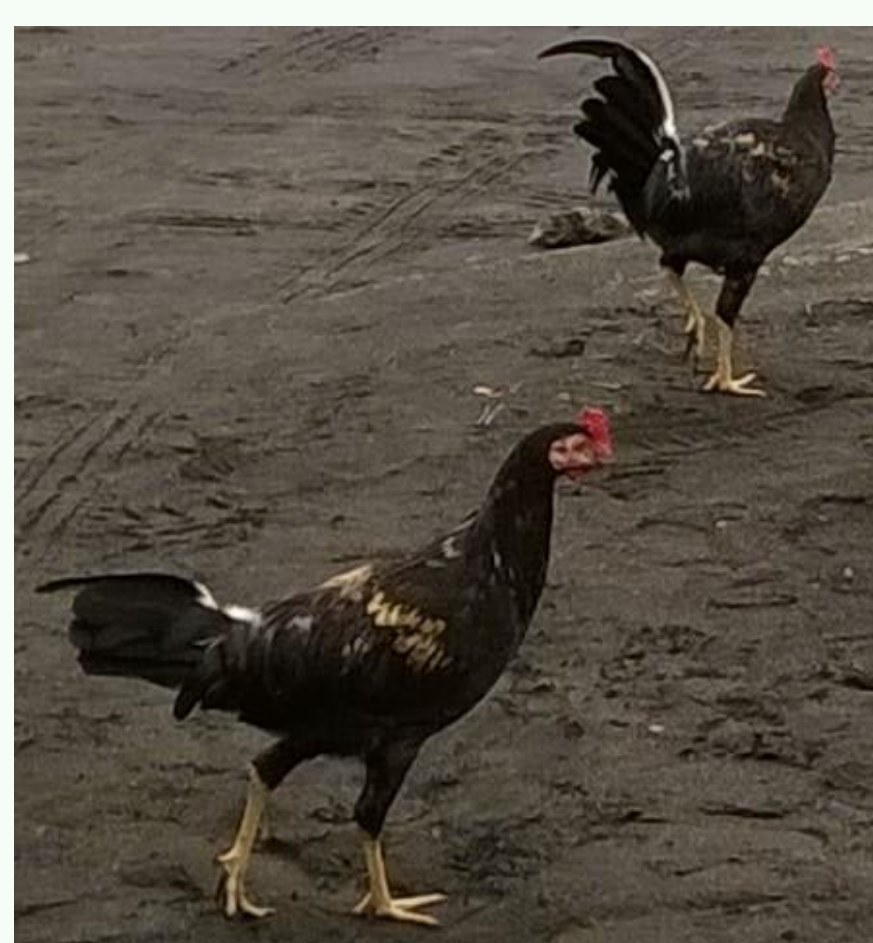
3 g/kg de PM Jurjanz et al 2015