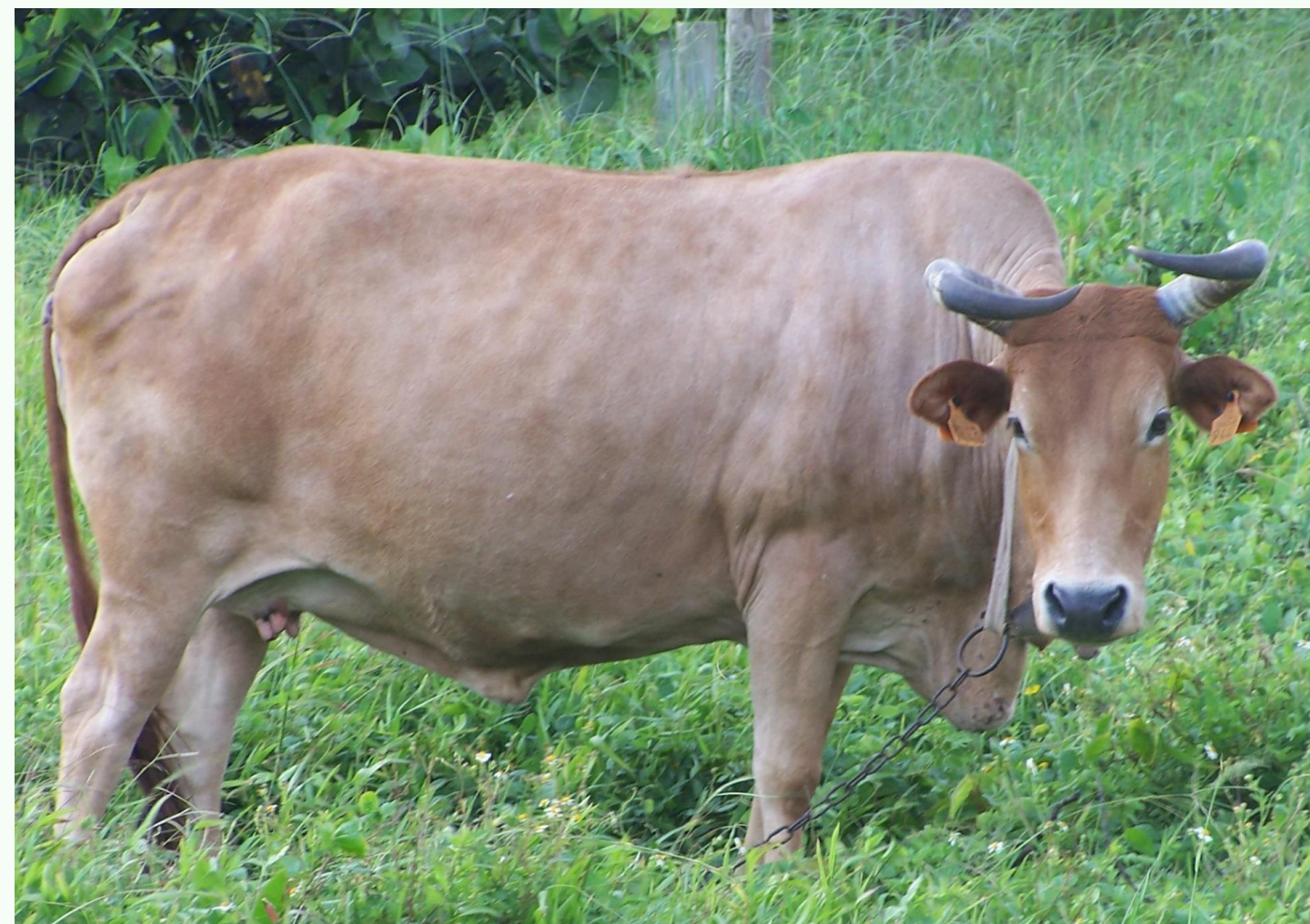
2 g/kg de poids métabolique (PM) Collas et al, 2020