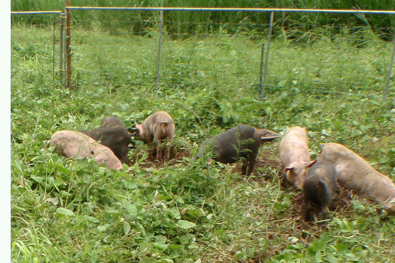
11 g/kg de PM Collas et al, 2022

Ces valeurs doivent être intégrées dans les évaluations de risques pour calculer l'exposition des animaux via la concentration de la CLD dans le sol de la parcelle.