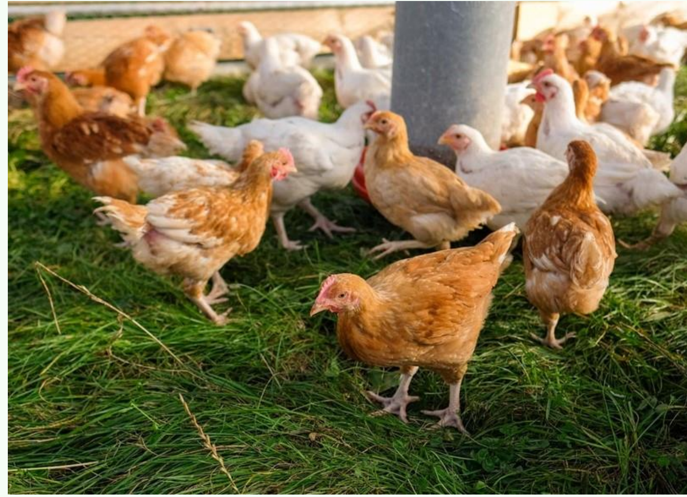
0,5 g/kg de PM Jurjanz et al 2015