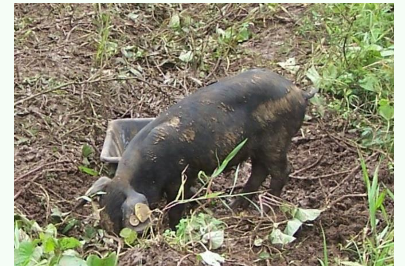
>25 g/kg PM (Collas et al 2023)

L'offre fourragère, donc la couverture du sol par la végétation, est un bon indicateur du risque accru d'ingestion de sol. Une herbe rase incite les animaux à pâturer près du sol. Des conditions très humides ou un fort piétinement par les animaux favorisent également la souillure d'herbe.