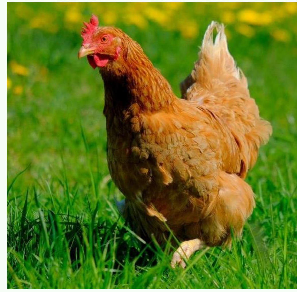
3 g/kg de PM Jondreville et al 2010