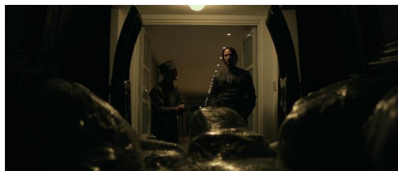
Figure 11 : Le nettoyeur emportant les cadavres laissés par John Wick ( John Wick 1 )

En tant qu'institution de pouvoir, La Grande Table a également mis en place sa propre économie avec sa propre monnaie, sous la forme de pièce marquée. Bien que ces pièces n'aient aucune valeur monétaire réelle, elles permettent d'acheter des biens et des services au sein des établissements, qui contribuent à leurs mises en service, rattaché à l'autorité de La Grande Table. John Wick pourra ainsi