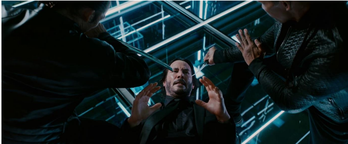
Figure 13 : John Wick se faisant mettre en joug par les étudiants de Zéro ( John Wick 3 )

dangerosité accrue de ses nouveaux opposants. John Wick, en se présentant à eux, avec un sabre, informe le spectateur que le combat sera un affrontement avec des lames. Il anticipe ainsi le type d'attaque que John Wick pourra porter ou subir. Sur les plans suivants, John Wick est incapable de toucher ses adversaires, qui parviennent à le maîtriser et à le mettre en joug (figure 13). Le spectateur est alors confronté à un schéma inhabituel, celui d'un John Wick vaincu. Lorsque les étudiants aideront John Wick à se relever, le retournement de cette situation aura surpris le spectateur, qui se sera fait prendre au jeu, et intégrera de ce fait, ce schéma dans sa spectature.