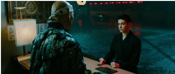
Figure 7 : L'adjudicatrice venant remettre un contrat à Zéro ( John Wick 3 )

assassins. Chaque contrat possède son mode de réception. Les contrats fermés sont attribués directement par le commanditaire (figure 7), tandis que les contrats ouverts sont envoyés par message à tous les assassins membres du système (figure 8).