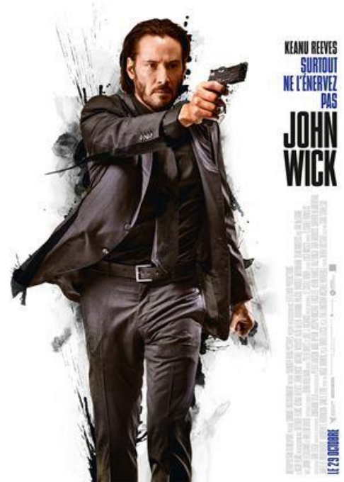
Figure 3 : Affiche promotionnelle de John Wick

John Wick est un ex-tueur à gages qui vient de perdre sa femme, Helen, des suites d'une maladie. Après sa mort, John Wick reçoit d'elle un chiot pour apaiser sa douleur. En s'arrêtant à une station essence, John Wick fait la rencontre de trois mafieux russes qui veulent acheter sa Ford Mustang. Il refuse puis repart. Le soir, les mafieux reviennent pour voler la voiture, agressent John Wick et tuent son chien. Décidé à se venger, John Wick déterre son passé de tueur à gages et part à la recherche des mafieux russes. Il apprendra que celui qui a tué son chien, Viggo Tarasov, est le fils du parrain de la mafia russe, et ex-employeur de John Wick, Iosef Tarasov. John Wick se rend au Continental, un hôtel de tueur à gages pour y découvrir l'emplacement de Viggo, tandis que Iosef place une prime sur la tête de John Wick. Après un premier échec de sa traque, John Wick se rend dans une église pour y coincer Viggo, l'épargne, et le force à révéler où se trouve son père qu'il ira tuer ensuite. Après avoir perdu son ami Marcus torturé puis tué par Viggo, John Wick se remet à sa poursuite, l'affronte sur un toit, le tue et fuit dans une clinique vétérinaire pour s'y soigner. Il en ressort avec un chien et part se promener près du pont qu'il fréquentait avec Helen.