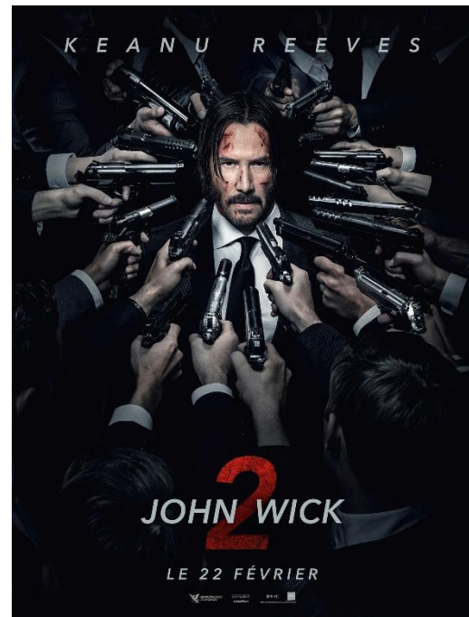
Figure 4 : Affiche promotionnelle de John Wick : Chapitre 2