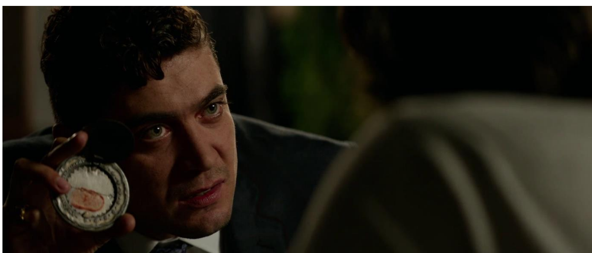
Figure 9 : Santino D'Antonio montrant à John Wick leur accord passé par le sang. ( John Wick 2 )

Dans John Wick 2 , le personnage de pouvoir Santino D'Antonio vient à la rencontre de John Wick pour lui présenter un médaillon, symbole d'une dette qu'il a contracté auprès de Santino D'Antonio. Pour s'en acquitter, il devra accepter le contrat fermé qui lui est présenté. Dans la diégèse des films, la dette est symbolisée par un médaillon en argent, qui, lorsque ouvert, révèle une surface circulaire, surmontée d'un pic, séparée en deux, pour y recevoir le sang des deux parties (figure 9), le médaillon est rempli par la personne qui demande de l'aide (le débiteur) et est conservé par la personne qui le lui apporte, (le créancier) pour être présentée au moment de la réclamation de cette dette.