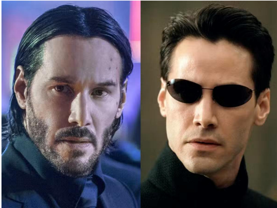
Figure 6 : Les codes iconiques de Néo se transposent sur ceux de John Wick via la figure du Keanu Reeves

Dans les films Matrix , Néo est désigné comme l' élu (The One) de son propre monde : la matrice. Destiné à la détruire, il devra s'en affranchir pour affronter les programmes et les machines qui la contrôlent. En reprenant ce schéma, impossible de ne pas voir se dresser des parallèles avec John Wick, s'il n'est pas qualifié d' élu, tout comme Néo, on lui confère une même stature de légende : Le Croque-mitaine (BoogeyMan en version originale). Si on admet l' analogie entre la matrice et le monde des assassins, la quête de John Wick et de Néo partage le même but, s' extirper d' une instance de dominance (machinique dans Matrix et institutionnelle dans John Wick ) pour la détruire. Par le biais de ces parallèles dressés, l' interprétation de John Wick faite par le spectateur peut s' établir dans le transit des schémas de Néo, nous renvoyant ici à la règle de la configuration, établie par Bernard Perron (1997, 229-231). Ainsi, la compréhension et l' anticipation du personnage de John Wick s' effectue par le produit de la comparaison narrative des rôles de Keanu Reeves.