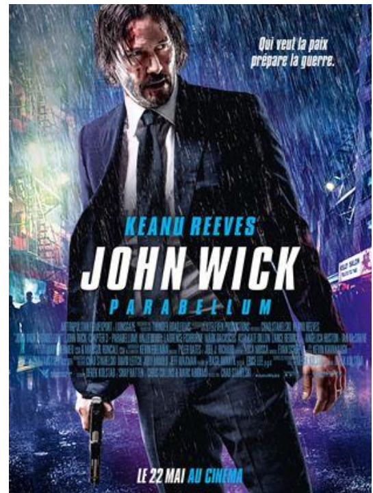
Figure 5 : Affiche promotionnelle de John Wick : Chapitre 3 - Parrabellum