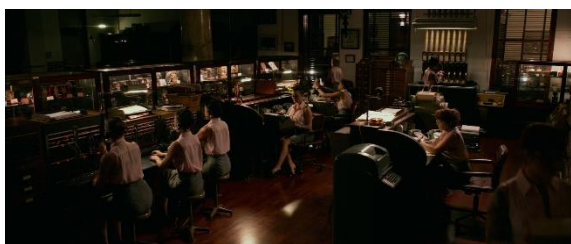
Figure 10 : Les fonctionnaires de l'administration traitant des demandes. ( John Wick 2 )

Dans les films, La Grande Table semble se définir comme une institution politique mettant en place des instances permettant la diffusion et la pérennisation de son autorité. Afin de la maintenir, l'organisation a mis en place une administration (figure 10) permettant l'application effective de décisions ; celle-ci est gérée par des fonctionnaires qui, lorsqu'ils reçoivent des demandes de la part de personnage de pouvoir, actualisent les contrats ou les statuts des acteurs du monde criminel. La Grande Table confère également une autorité à d'autres organismes afin d'encadrer les activités criminelles, comme pour le Continental, ou de développer des formations parallèles, comme le service de nettoyage (figure 11). Enfin, La Grande Table emploie directement des fonctionnaires, à qui elle délègue son autorité, pour régler des affaires importantes mettant en péril sa stabilité et sa sécurité, comme le personnage de l'Adjudicatrice dans John Wick 3 .