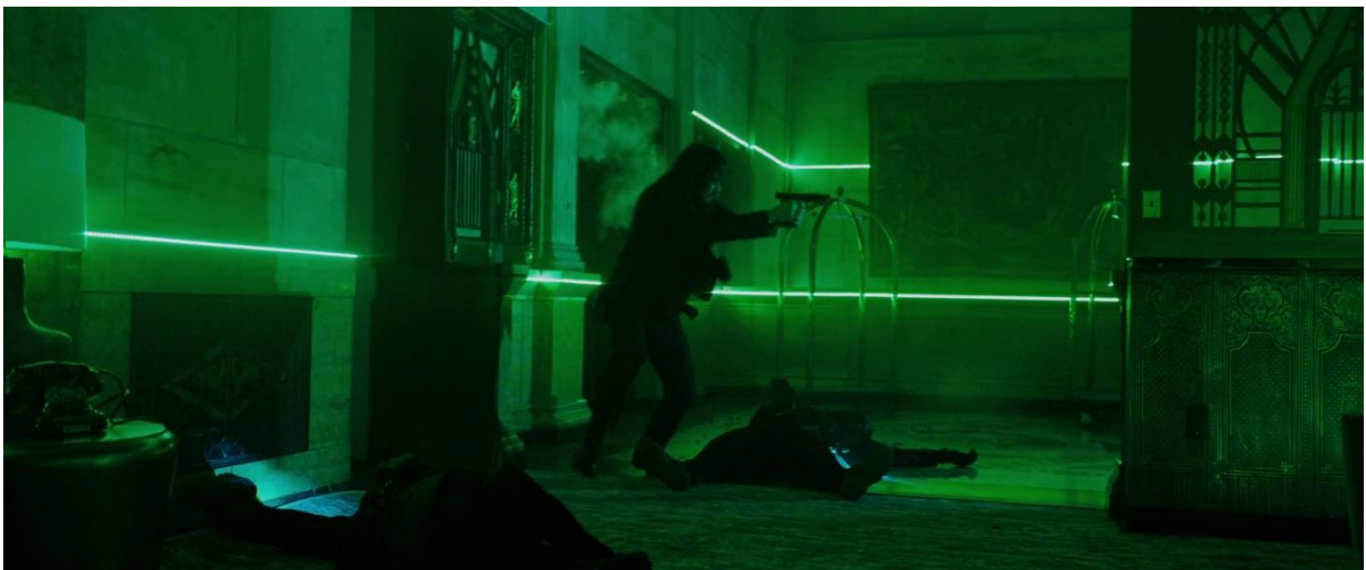
Figure 14 : John Wick faisant face au mercenaire de La Grande Table dans l'enceinte du Continental de New York (John Wick 3)

Pour parvenir à relancer le spectateur dans une partie-jeu filmique à laquelle il aurait, en quelque sorte, déjà joué, le réalisateur actualise la fiction par le champ d'action de John Wick, complexifiant davantage la progression du joueur dans le récit. L'ajout de ces nouvelles règles est un moyen d'actualiser le récit, en surprenant toujours le spectateur, qui ne peut plus l'anticiper avec sa seule connaissance des précédents opus. C'est également de cette actualisation du jeu que provient le plaisir de joueur, l'apparition de nouvelles règles contribue à la création de nouvelles formes de dénouements pour l'intrigue, de la même façon que la transgression des règles participe au retournement et à la surprise du spectateur. Ainsi, lorsque dans John Wick 3 le Continental de New York sert de champ de bataille (figure 14), alors que les deux films précédents nous l'ont présenté comme une instance « intouchable et civilisé », le spectateur retire du plaisir, de la mutation des règles, et de la découverte d'une nouvelle mise en action du jeu.