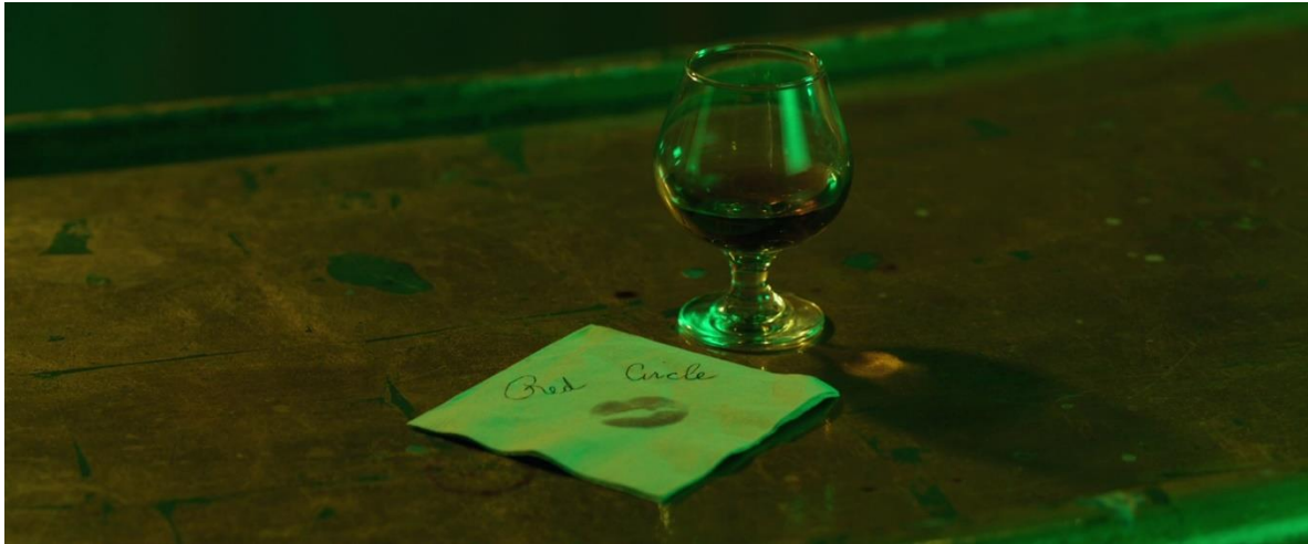
Figure 12 : L'information que recherche John Wick est donnée indirectement par Winston ( John Wick 1 )

Quant à la seconde aide, nous pourrions la caractériser d'aide « à l'action », l'allié va accompagner John Wick dans son action pour faciliter sa progression. Toujours dans le premier film, alors que John Wick a été capturé par les hommes de Viggo Tarasov, l'un d'entre eux commence à l'asphyxier pour tenter de le tuer. Soudain, Marcus abat l'homme tentant de le tuer depuis un toit voisin, ce qui permet à John Wick de se libérer de l'emprise de ses gardes pour tuer le dernier.