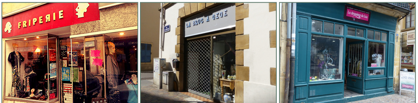
Figure 1 : Friperie Le Bardak, La Broc à Gégé et le Dressing de Léa : 3 enseignes de seconde main à Metz.

qu'Emmaüs, qui privilégient le système de donation et de vente à faible prix afin de remettre en circulation des objets d'occasion, avec comme toile de fond une action sociale ; 2/ Une forme informelle, à travers des marchés officiels, se constituant autour d'une population en marge (Balan, 2017) ou bien, de vide-greniers, de bourses aux jouets/articles de puériculture, ou de marchés aux puces organisés au bon gré des vendeurs informels. Cette deuxième forme est en pleine mutation, notamment à travers le développement des plateformes digitales pour la vente de biens d'occasion ; 3/ Une forme commerciale dite « traditionnelle », se rappro-