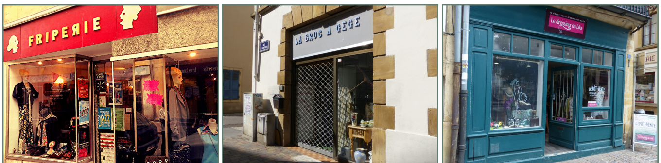
Figure 1 : Friperie Le Bardak, La Broc à Gégé et le Dressing de Léa : 3 enseignes de seconde main à Metz. Clichés Nicolas Dorkel/LOTERR, 2021.

3/ Une forme commerciale dite « traditionnelle », se rappro-