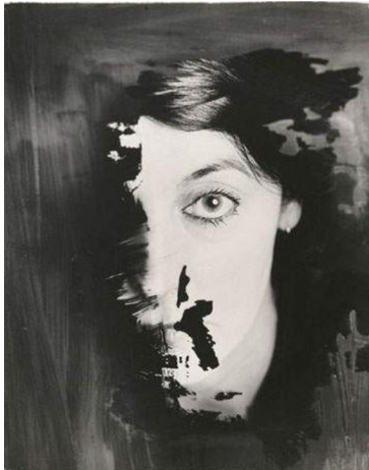
(, Annette Messager, 1988, collection privée)