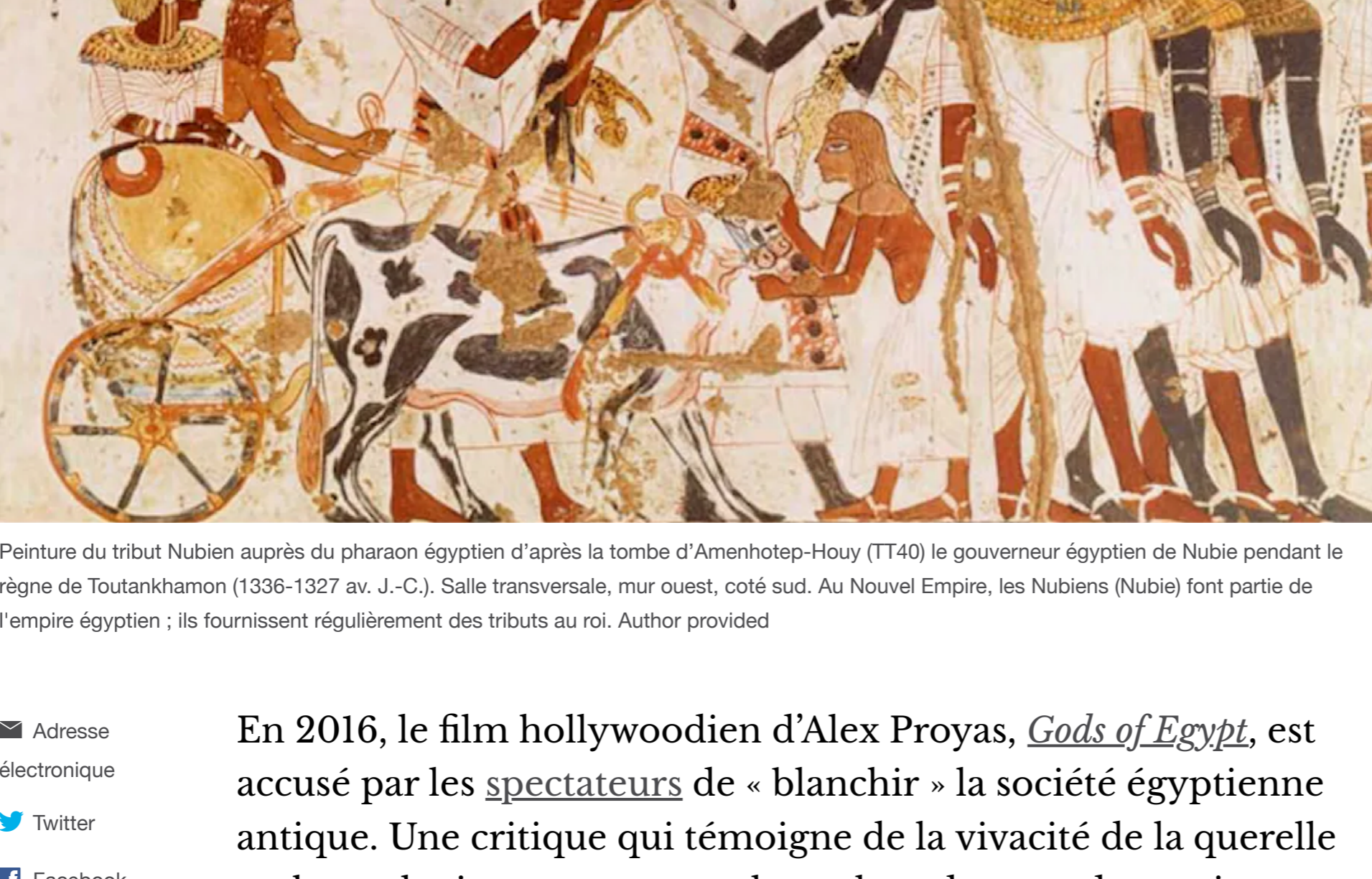
Peinture du tribut Nubien après du pharaon égyptien d'après la tombe d'Amenhotep-Houy (TT40) le gouverneur égyptien de Nubie pendant le règne de Toutankhamon (1336-1327 av. J.-C.). Salle transversale, mur ouest, côté sud. Au Nouvel Empire, les Nubiens (Nubie) font partie de l'empire égyptien : ils fournissent régulièrement des tributs au roi.