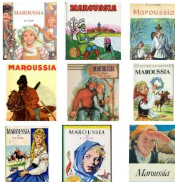
Couvertures de Maroussia par P.-J. Stahl.

Il est indéniable que l'éditeur a un souci constant de maîtriser la réception de « sa » Maroussia par « son » public. Pour ce faire, il n'hésite pas, pour contrôler l'interprétation et les effets perlocutoires du texte, à modifier son dispositif paratextuel d'une édition à l'autre. Par exemple, il lui apparaît, très vite, que la mort de Maroussia, dans le récit historique de M. Vovtchok, présente deux inconvénients majeurs : d'une part ne pas « coller » avec les objectifs de son entreprise éditoriale, à savoir proposer à la jeunesse une « récréation » amusante, et, d'autre part indisposer le jeune public auquel elle s'adresse. Aussi, après la prépublication en feuilleton du récit dans la presse, P.-J. Hetzel (1878 : 270) ajoute-t-il un