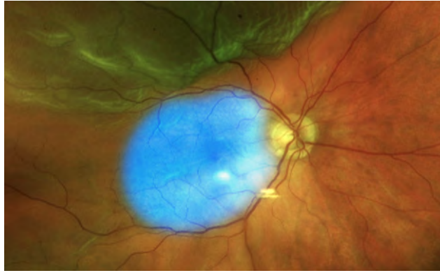
Fig. 1. Ultra-wide-field Fundus imaging with Optos P200Tx (Optos Carifornia®, Scotland, United Kingdom) showing a macula highlighted by blue coloration on an upper RRD with an upper break position.