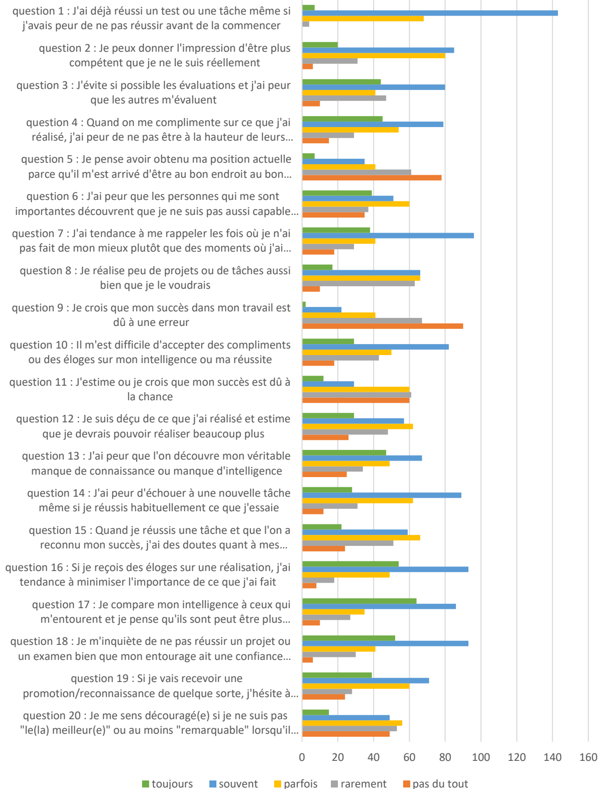
Figure 2 : réponse au questionnaire CLANCE : représentation de la répartition des réponses à chacun des items du questionnaire de CLANCE.