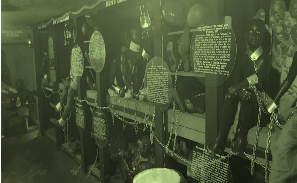
Figure 2 - Le bateau négrier, vue de l'intérieur, Great Blacks in Wax Museum, Baltimore. 6 juillet 2019.

Une bande son mêle bruits de vagues, grincements et raclements, gémissements et plaintes étouffées, cris et sanglots, donnant un caractère lugubre et oppressant à l'expérience. Les chaînes enserrant les poignets, les chevilles, les cous ; les mannequins sont présentés de face, de profil, couchés dans d'étroits châliis, placés tête-bêche avec leurs compagnons d'infortune. Des photographies et des silhouettes dessinées placées à l'arrière des mannequins renforcent l'impression de surpeuplement de l'espace. Enfin, de part et d'autre de la pièce, une scène de viol, où le mannequin d'une femme est forcé de s'agenouiller devant un homme blanc, tandis qu'à l'autre extrémité, c'est un homme blanc qui se trouve agenouillé, le cou entravé d'une chaîne que deux esclaves rebelles enroulent autour de son cou. En ressortant du bateau, le visiteur découvre une scène ultime : la jetée par-dessus bord d'un esclave par les marins.