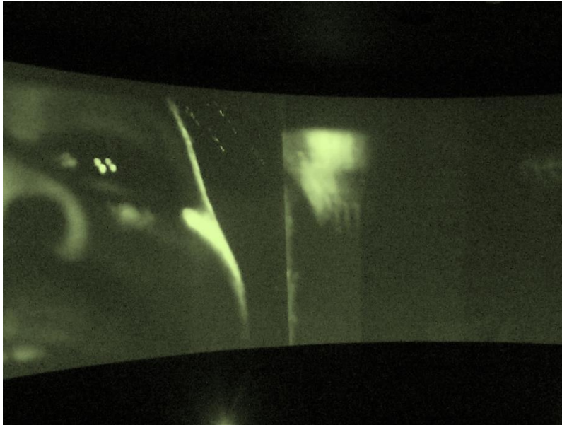
Figure 1 - Le Passage du Milieu, installation vidéo, International Slavery Museum, Liverpool. PH Gaëlle Crenn, 10 septembre 2011. Copyright International Slavery Museum, Liverpool, Angleterre.

la caméra bouge comme si le tournage avait lieu dans un bateau qui tangue et transfère la perspective qui donne un léger vertige au spectateur. Cela procure un sentiment de dislocation, de mouvement involontaire et de confinement claustrophobique dans un espace restreint (Arnold-de-Simine, 2012 : 34).