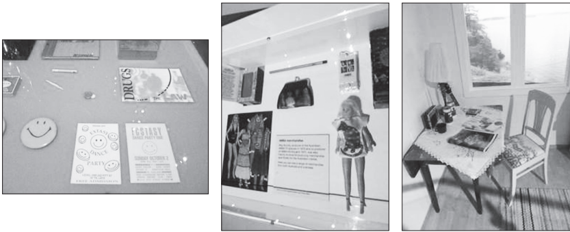
Photographies 5, 6 et 7. De gauche à droite : vitrine, objets de fête, « The Eighties are Back » ; vitrine, produits dérivés, « Abbaworld » ; hutte suédoise, détail, « Abbaworld » (photographies : G. Crenn, 2011).

Dans « Abbaworld », la vision – finalement lisse – qui est proposée de la musique d'ABBA et de ses rapports à la société, s'accompagne d'une invitation à la célébration de l'unité, à travers l'amour partagé par des fans des différentes générations. Le statut donné à la musique d'ABBA est celui d'un vecteur de renforcement et d'apaisement des liens sociaux, l'ensemble très large des fans communiant dans une musique, qui, de plus, comme l'expriment de nombreux visiteurs, possède la qualité de rendre ses auditeurs, « simplement heureux » (« simply happy »).