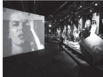
Photographies 2, 3 et 4. De gauche à droite : costume de Mamma Mia sous vitrine, « Abbaworld » ; costumes, « Abbaworld » ; section musique, « The Eighties are Back » (photographies : G. Crenn, 2011).

Ce que le commissaire cherche à provoquer est avant tout une « reconnaissance » de l'objet par les publics : ces objets sont des objets communs, évocateurs de la période, que les visiteurs peuvent s'approprier pour créer et échanger leurs propres significations. Pour Peter Cox, il s'agit de