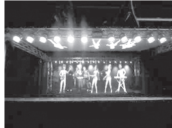
Photographie 10. Groupe de performeurs sur scène, « Abbaworld ».

Un dernier type de dispositif est commun aux deux expositions : elles comprennent de nombreux jeux : jeux vidéo iconiques (Ping-pong, Pacman, etc.) insérées dans des tables basses pour « The Eighties », auxquels les visiteurs peuvent s'attabler, seuls, ou face à un adversaire 21 . Les tables de jeux font partie de la première partie de l'exposition qui traite des jeux vidéo, elle est complétée par la partie « Jouets et figurines » qui expose ces produits dérivés de ces jeux vidéo. Dans « Abbaworld », le visiteur peut s'adonner au Jeu de mixage