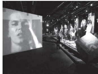
Photographies 2, 3 et 4. De gauche à droite : costume de Mamma Mia sous vitrine, « Abbaworld » ; costumes, « Abbaworld » ; section musique, « The Eighties are Back » (photographies : G. Crenn, 2011).

Ce que le commissaire cherche à provoquer est avant tout une « reconnaissance » de l'objet par les publics : ces objets sont des objets communs, évocateurs de la période, que les visiteurs peuvent s'approprier pour créer et échanger leurs propres significations. Pour Peter Cox, il s'agit de