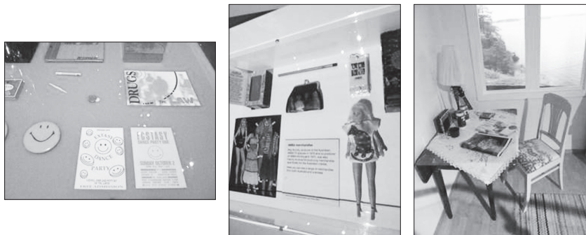
Photographies 5, 6 et 7. De gauche à droite : vitrine, objets de fête, « The Eighties are Back » ; vitrine, produits dérivés, « Abbaworld » ; hutte suédoise, détail, « Abbaworld » (photographies : G. Crenn, 2011).

Dans « Abbaworld », la vision – finalement lisse – qui est proposée de la musique d'ABBA et de ses rapports à la société, s'accompagne d'une invitation à la célébration de l'unité, à travers l'amour partagé par des fans des différentes générations. Le statut donné à la musique d'ABBA est celui d'un vecteur de renforcement et d'apaisement des liens sociaux, l'ensemble très large des fans communiant dans une musique, qui, de plus, comme l'expriment de nombreux visiteurs, possède la qualité de rendre ses auditeurs, « simplement heureux » (« simply happy »).