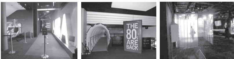
Photographies 8, 9 et 10. D gauche à droite : entrée de l'exposition « Abbaworld » ; entrée de l'exposition « The Eighties are Back » ; le cube Disco, « The Eighties are Back ».

Dans la partie de « The Eighties » consacrée à la musique, un autre dispositif immersif se remarque : le « cube disco » (photographie 4c) est un espace carré, d'environ trois mètres de côté, dans lequel un boîtier permet de déclencher musique et projections visuelles sur les murs et le plafond. Celles-ci évoquent l'univers des discothèques et