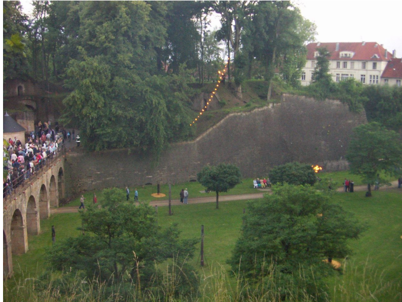
Illustration 5. « Citadelles de Feu », Longwy. Illumination des fortifications.

plusieurs des lieux illuminés, inaugurant ainsi à travers leur circuit une (re)découverte et une perception renouvelée de leur région et de son patrimoine.