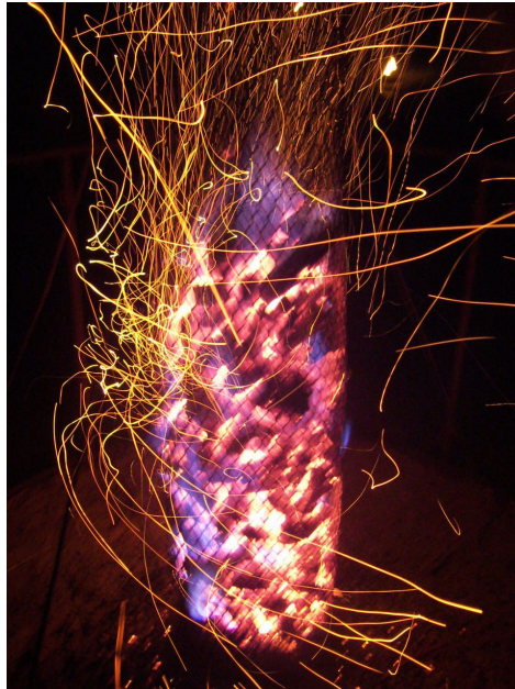
Illustration 4. Brasero, Citadelles de feu, Marsal.