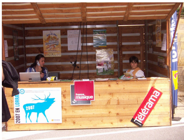
Illustration 3a et 3b. RenaissanceS, Bar le Duc. Renforcement de la communication régionale.