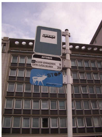
Illustration 2 : Signalétique urbaine de l'événement à Luxembourg

ment de la signalétique sur les sites en Lorraine. À l'échelle de la Grande Région, les conditions d'exposition des publics aux supports communicationnels de l'événement ont été très contrastées : omniprésente sur le périmètre de la ville de Luxembourg et très présente et dans l'ensemble du Grand-Duché, – au risque parfois d'un excès critiqué par les habitants (effet de matraquage), la signalétique de « Luxembourg 2007 » est en Rhénanie-Palatinat concentré principalement sur la ville de Trèves (très investie, et lieu central des manifestations de cette région 7 . À l'inverse, elle est quasiment absente en Wallonie, à l'exception de quelques opérations, telles que par exemple « Best of Nature » 8 , mais qui mettent en avant plutôt leur logo spécifique que le cerf bleu. En Sarre, la présence des emblématiques cerfs bleus en métal, reste encore notable trois ans après l'événement, par exemple aux alentours de la Volklinger Hütte 9 , signe de l'imprégnation de l'événement.